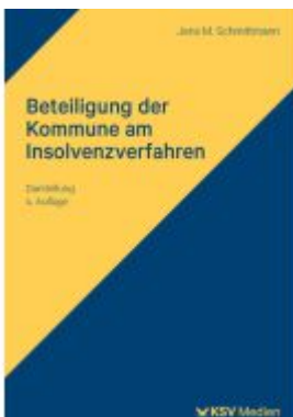
Beteiligung der Kommune am Insolvenzverfahren Ladenpreis: 40,10EUR