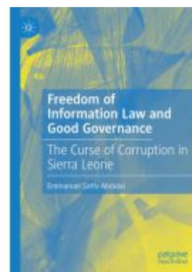
Freedom of Information Law and Good Governance Ladenpreis: 164,99EUR