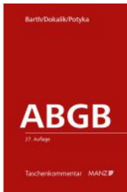
Das Allgemeine bürgerliche Gesetzbuch ABGB Ladenpreis: 134,00EUR