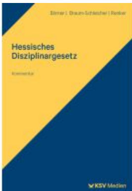
Hessisches Disziplinalgesezt Ladenpreis: 50,40EUR