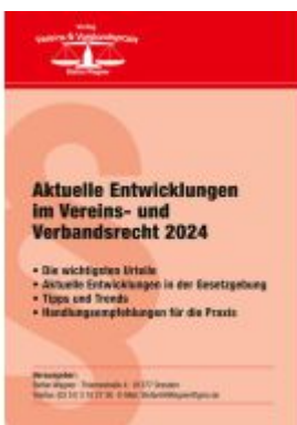
Aktuelle Entwicklungen im Vereins- und Verbandsrecht 2024 Ladenpreis: 24,80EUR