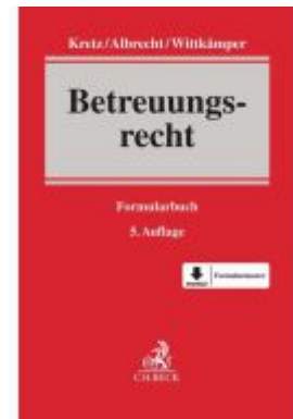
Betreuungsrecht Ladenpreis: 87,40EUR