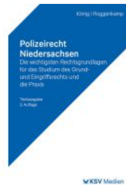
Polizeirecht Niedersachsen Ladenpreis: 28,80EUR