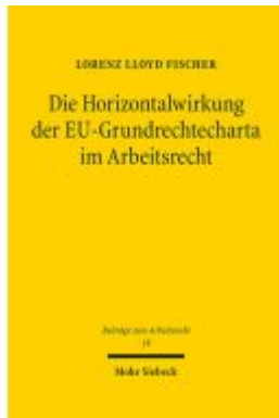
Die Horizontalwirkung der EU-Grundrechtecharta im Arbeitsrecht Ladenpreis: 107,00EUR