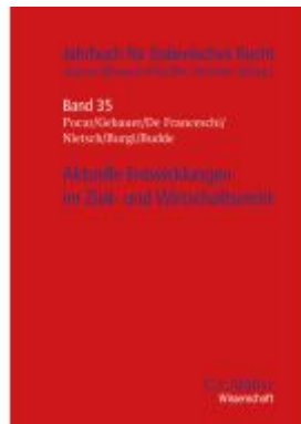
Aktuelle Entwicklungen im Zivil- und Wirtschaftsrecht Ladenpreis: 123,40EUR