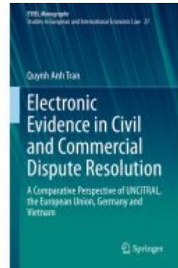
Electronic Evidence in Civil and Commercial Dispute Resolution Ladenpreis: 175,99EUR