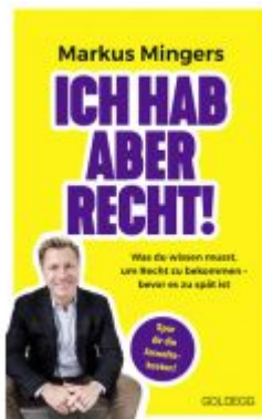
Ich hab aber recht! Was du wissen musst, um recht zu bekommen – bevor es zu spät ist. Häufige Rechtsirrtümer und praktisches Wissen zu Rechten im Alltag vom Spitzenanwalt erklärt Ladenpreis: 19,00EUR