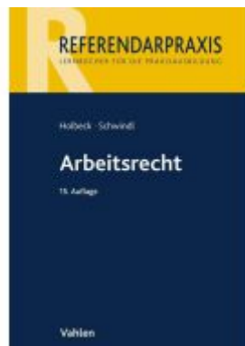
Arbeitsrecht Ladenpreis: 24,60EUR