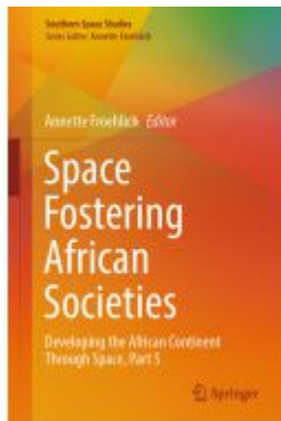
Space Fostering African Societies Ladenpreis: 175,99EUR