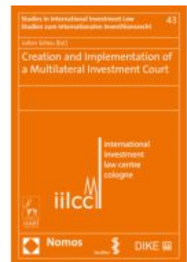
Creation and Implementation of a Multilateral Investment Court Ladenpreis: 91,50EUR