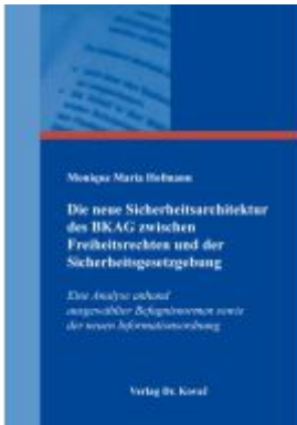
Die neue Sicherheitsarchitektur des BKAG zwischen Freiheitsrechten und der Sicherheitsgesetzgebung Ladenpreis: 102,60EUR