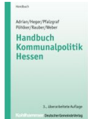
Handbuch Kommunalpolitik Hessen Ladenpreis: 29,90EUR