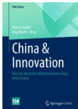
China & Innovation Ladenpreis: 30,83EUR