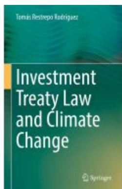
Investment Treaty Law and Climate Change Ladenpreis: 175,99EUR