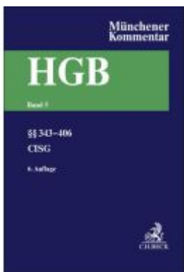
Münchener Kommentar zum Handelsgesetzbuch Bd. 5: Viertes Buch. Handelsgeschäfte Ladenpreis: 297,10EUR