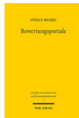
Bewertungsportale Ladenpreis: 96,70EUR