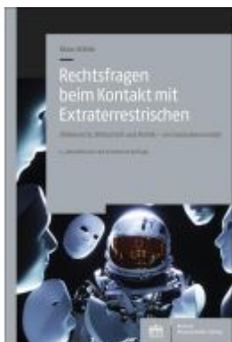
Rechtsfragen beim Kontakt mit Extraterrestrischen Ladenpreis: 40,10EUR