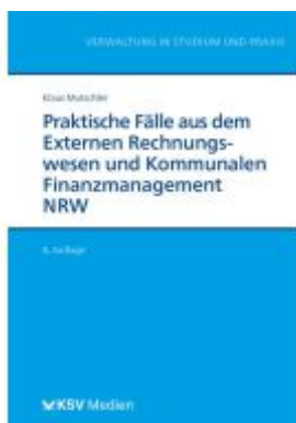
Praktische Fälle aus dem Externen Rechnungswesen und Kommunalen Finanzmanagement NRW Ladenpreis: 24,70EUR