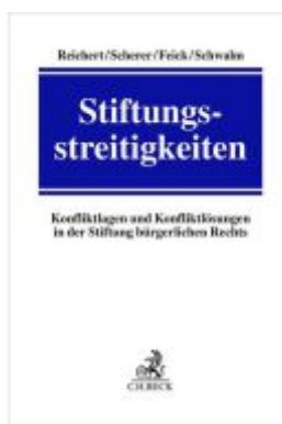
Stiftungsstreitigkeiten Ladenpreis: 204,60EUR