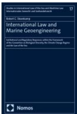
International Law and Marine Geoengineering Ladenpreis: 107,00EUR

Wir haben andere Produkte gefunden, die Ihnen gefallen könnten!