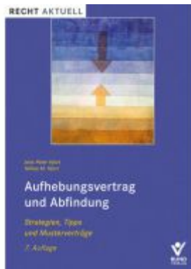
Aufhebungsvertrag und Abfindung Ladenpreis: 26,80EUR