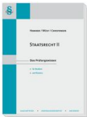
Staatsrecht II Ladenpreis: 22,50EUR

Wir haben andere Produkte gefunden, die Ihnen gefallen könnten!