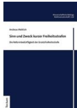
Sinn und Zweck kurzer Freiheitsstrafen Ladenpreis: 29,90EUR