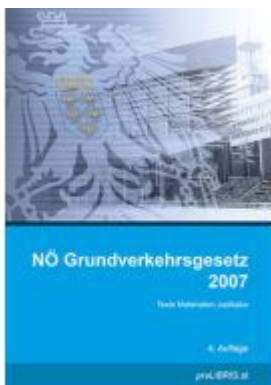
NÖ Grundverkehrsgesetz 2007 Ladenpreis: 23,00EUR