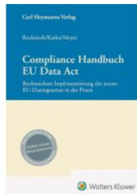
Compliance Handbuch EU Data Act Ladenpreis: 173,80EUR