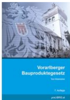
Vorarlberger Bauproduktegesetz Ladenpreis: 15,00EUR