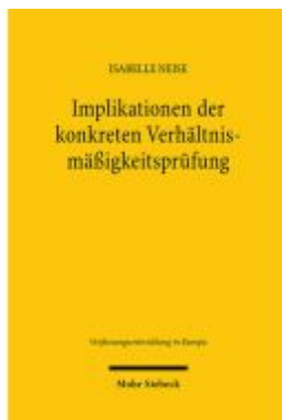
Implikationen der konkreten Verhältnismäßigkeitsprüfung Ladenpreis: 81,30EUR