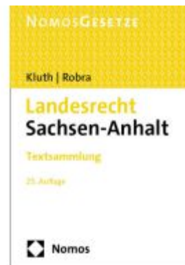
Landesrecht Sachsen-Anhalt Ladenpreis: 30,80EUR