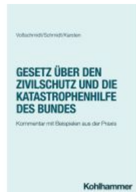
Gesetz über den Zivilschutz und die Katastrophenhilfe des Bundes Ladenpreis: 51,40EUR