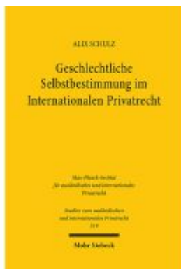
Geschlechtliche Selbstbestimmung im Internationalen Privatrecht Ladenpreis: 86,40EUR