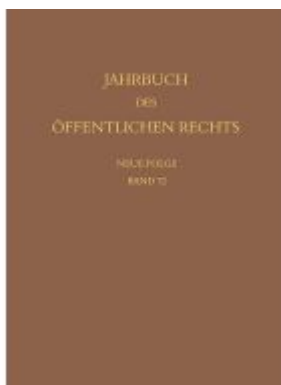
Jahrbuch des öffentlichen Rechts der Gegenwart. Neue Folge Ladenpreis: 256,00EUR