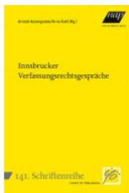
Innsbrucker Verfassungsrechtsgespräche Ladenpreis: 25,00EUR