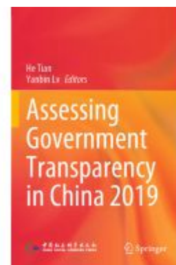
Assessing Government Transparency in China 2019 Ladenpreis: 109,99EUR