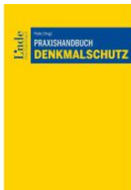
Praxishandbuch Denkmalschutz Ladenpreis: 99,00EUR