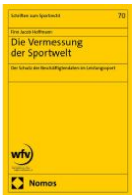
Die Vermessung der Sportwelt Ladenpreis: 91,50EUR