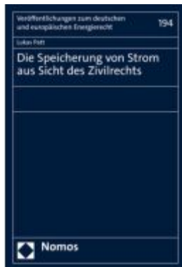
Die Speicherung von Strom aus Sicht des Zivilrechts Ladenpreis: 86,40EUR