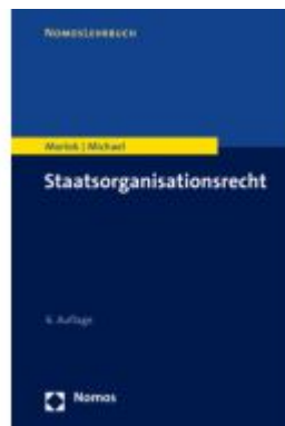
Staatsorganisationsrecht Ladenpreis: 27,70EUR