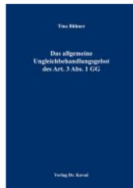
Das allgemeine Ungleichbehandlungsgebot des Art. 3 Abs. 1 GG Ladenpreis: 102,60EUR