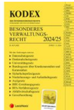
KODEX Besonderes Verwaltungsrecht 2024/25 - inkl. App Ladenpreis: 70,00EUR