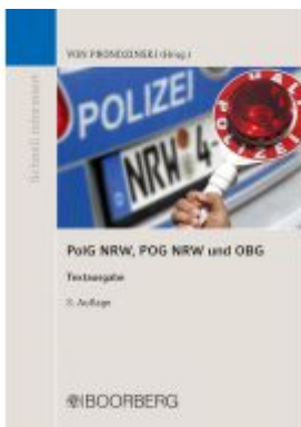
PolG NRW, POG NRW und OBG Ladenpreis: 13,20EUR