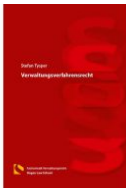
Verwaltungsverfahrenrecht Ladenpreis: 50,40EUR