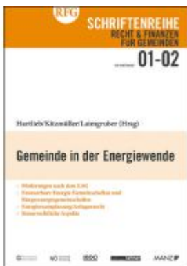
Gemeinde in der Energiewende Ladenpreis: 29,80EUR