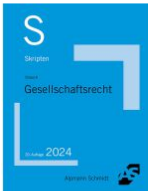
Skriptum Gesellschaftsrecht Ladenpreis: 23,60EUR