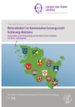
Reformbedarf im Kommunalverfassungsrecht Schleswig- Holsteins, insbesondere in der Kreisordnung und mit Blick auf das Verhältnis von Ehren- und Hauptamt Ladenpreis: 17,00EUR