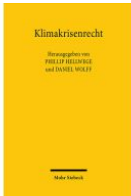
Klimakrisenrecht Ladenpreis: 91,50EUR