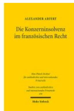
Die Konzerninsolvenz im französischen Recht Ladenpreis: 122,40EUR