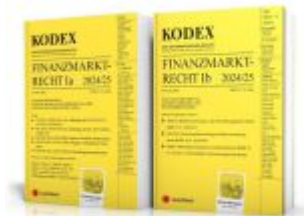
KODEX Finanzmarktrecht Band Ia + Ib 2024/25 - inkl. App Ladenpreis: 103,00EUR

Wir haben andere Produkte gefunden, die Ihnen gefallen könnten!