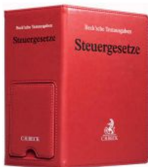
Steuergesetze Ladenpreis: 40,10EUR