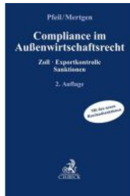
Compliance im Außenwirtschaftsrecht Ladenpreis: 122,40EUR