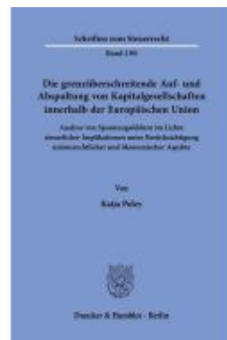
Die grenzüberschreitende Auf- und Abspaltung von Kapitalgesellschaften innerhalb der Europäischen Union. Ladenpreis: 133,60EUR