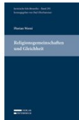
Religionsgemeinschaften und Gleichheit Ladenpreis: 145,00EUR