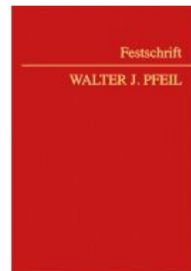
Festschrift Pfeil Ladenpreis: 168,00EUR