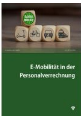
E-Mobilität in der Personalverrechnung Ladenpreis: 25,00EUR