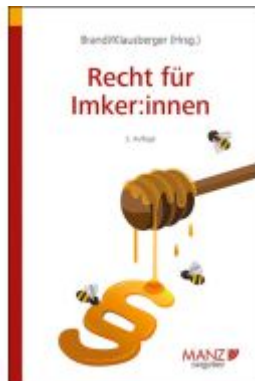
Recht für Imker:innen Ladenpreis: 23,80EUR

Wir haben andere Produkte gefunden, die Ihnen gefallen könnten!