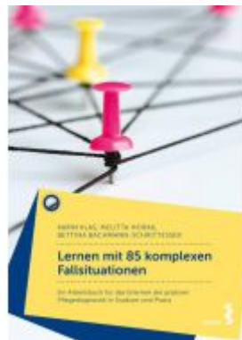
Lernen mit 85 komplexen Fallsituationen Ladenpreis: 28,90EUR