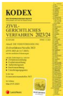
KODEX Zivilgerichtliches Verfahren 2023/24 - inkl. App Ladenpreis: 43,00EUR