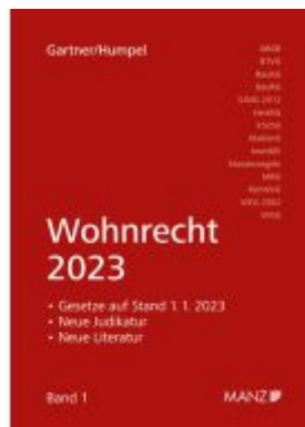
Wohnrecht 2023 Ladenpreis: 48,00EUR