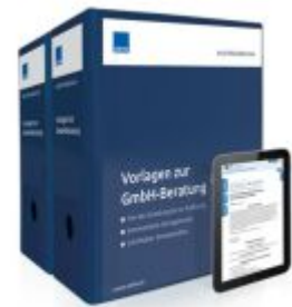
Vorlagen zur GmbH-Beratung Ladenpreis: 250,80EUR