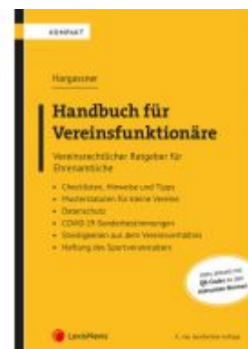
Handbuch für Vereinsfunktionäre Ladenpreis: 49,00 EUR