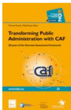
Transforming Public Administration with CAF Ladenpreis: 46,80 EUR