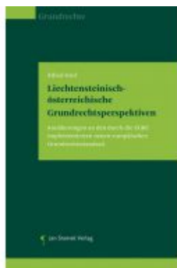
Liechtensteinisch-österreichische Grundrechtsperspektiven Ladenpreis: 39,90 EUR