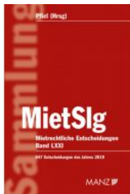
Mietrechtliche Entscheidungen MietSlg Ladenpreis: 224,00 EUR

Wir haben andere Produkte gefunden, die Ihnen gefallen könnten!