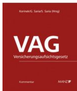
VAG - Versicherungsaufsichtsgesetz Ladenpreis: 328,00 EUR