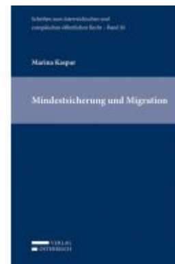
Mindestsicherung und Migration Ladenpreis: 79,00 EUR