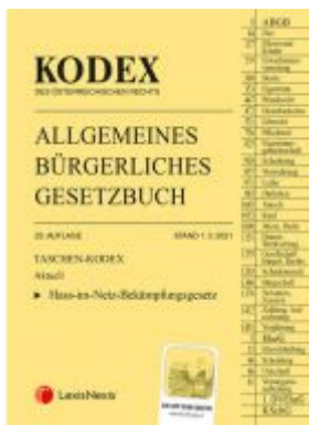
Taschen-Kodex ABGB 2021 - inkl. App Ladenpreis: 19,00 EUR