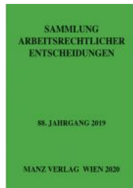
Sammlung arbeitsrechtlicher Entscheidungen Ladenpreis: 96,00 EUR