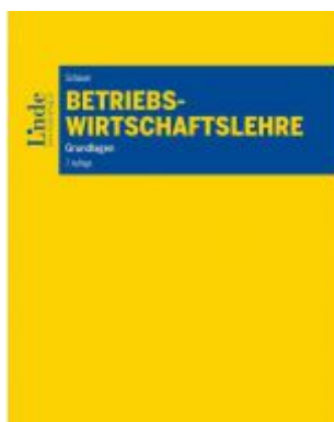
Betriebswirtschaftslehre Ladenpreis: 35,00 EUR