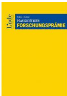
Praxisleitfaden Forschungsprämie Ladenpreis: 58,00 EUR