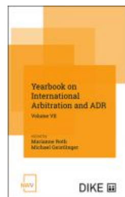
Yearbook on International Arbitration and ADR Ladenpreis: 84,00 EUR