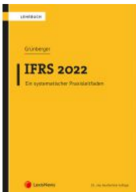
IFRS 2022 Ladenpreis: 42,00 EUR

Wir haben andere Produkte gefunden, die Ihnen gefallen könnten!