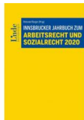
Innsbrucker Jahrbuch zum Arbeits- und Sozialrecht 2020 Ladenpreis: 52,00 EUR