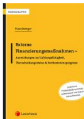
Externe Finanzierungsmaßnahmen - Auswirkungen auf Zahlungsfähigkeit, Überschuldungsstatus & Fortbestehensprognose Ladenpreis: 46,00 EUR