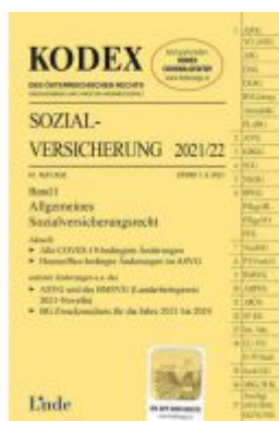
KODEX Sozialversicherung 2021/22, Band I Ladenpreis: 42,00 EUR