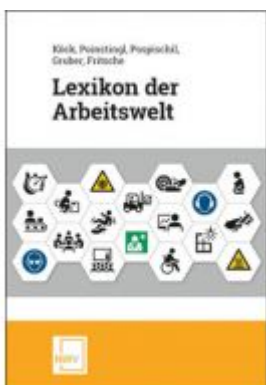
Lexikon der Arbeitswelt Ladenpreis: 69,00 EUR