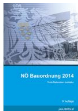
NÖ Bauordnung 2014 Ladenpreis: 34,00EUR