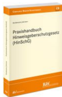
Praxishandbuch Hinweisgeberschutzgesetz (HinSchG) Ladenpreis: 112,10EUR