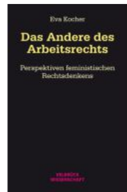
Das Andere des Arbeitsrechts Ladenpreis: 39,90EUR

Alle Preise inkl. MwSt. zzgl. Versand. Bei Bestellung im LexisNexis Onlineshop kostenloser Versand innerhalb Österreichs.