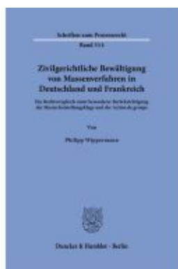
Zivilgerichtliche Bewältigung von Massenverfahren in Deutschland und Frankreich Ladenpreis: 92,50EUR