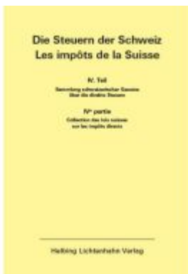
Die Steuern der Schweiz: Teil IV EL 193 Ladenpreis: 301,00EUR