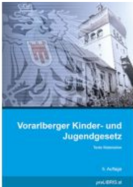
Vorarlberger Kinder- und Jugendgesetz Ladenpreis: 20,00EUR

Wir haben andere Produkte gefunden, die Ihnen gefallen könnten!