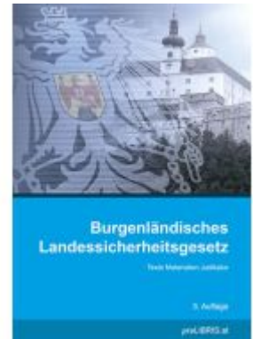
Burgenländisches Landessicherheitsgesetz Ladenpreis: 11,00EUR