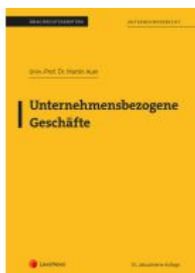
Unternehmensbezogene Geschäfte (Skriptum) Ladenpreis: 25,00EUR