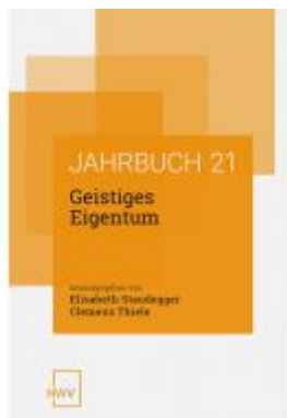
Geistiges Eigentum Ladenpreis: 68,00EUR