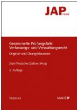
Gesammelte Prüfungsfälle Verfassungs- und Verwaltungsrecht Ladenpreis: 33,00EUR