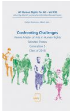
Confronting Challenges Ladenpreis: 52,00EUR