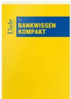
Bankwissen kompakt Ladenpreis: 58,00EUR

Wir haben andere Produkte gefunden, die Ihnen gefallen könnten!