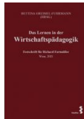
Das Lernen in der Wirtschaftspädagogik Ladenpreis: 34,00EUR