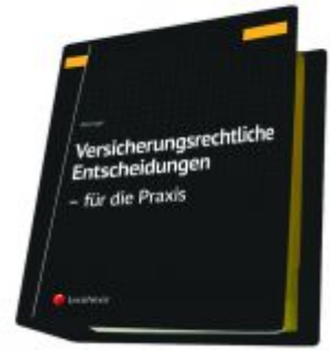
Versicherungsrechtliche Entscheidungen - aufbereitet für die Praxis Ladenpreis: 329,00EUR