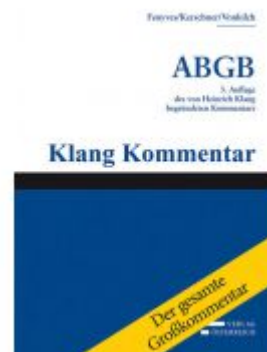
Großkommentar zum ABGB - Klang Kommentar Ladenpreis: 5.166,00EUR