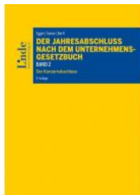
Der Jahresabschluss nach dem Unternehmensgesetzbuch, Band 2 Ladenpreis: 90,00EUR