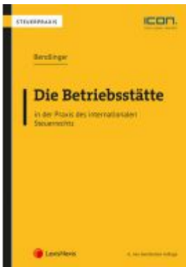
Die Betriebsstätte in der Praxis des internationalen Steuerrechts Ladenpreis: 86,00EUR