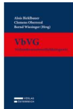
VbVG - Verbandsverantwortlichkeitsgesetz Ladenpreis: 169,00EUR