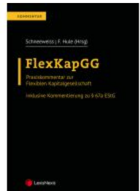
FlexKapGG Ladenpreis: 95,00EUR

Alle Preise inkl. MwSt. zzgl. Versand. Bei Bestellung im LexisNexis Onlineshop kostenloser Versand innerhalb Österreichs.