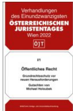
Öffentliches Recht Grundrechtsschutz vor neuen Herausforderungen Ladenpreis: 48,00EUR