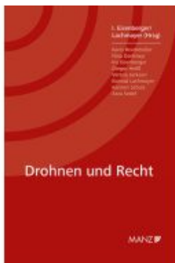
Drohnen und Recht Ladenpreis: 42,00EUR