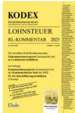
KODEX Lohnsteuer Richtlinien-Kommentar 2023 Ladenpreis: 62,00EUR