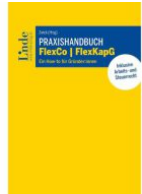
Praxishandbuch FlexCo | FlexKapG Ladenpreis: 59,00EUR