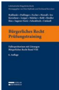
Bürgerliches Recht Prüfungstraining Ladenpreis: 39,00EUR