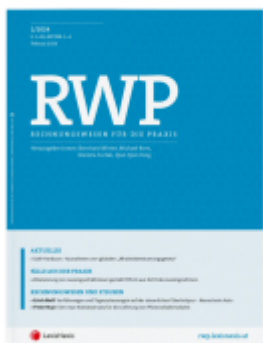
RWP Zeitschrift - Jahres-Abonnement (6 Hefte) Ladenpreis: 0,00EUR