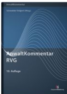
AnwaltKommentar RVG Aktionspreis: 163,50EUR Ladenpreis: 184,10EUR