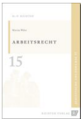
Juristische Grundkurse / Band 15 - Arbeitsrecht Ladenpreis: 11,10EUR