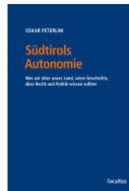
Südtirols Autonomie Ladenpreis: 29,00EUR