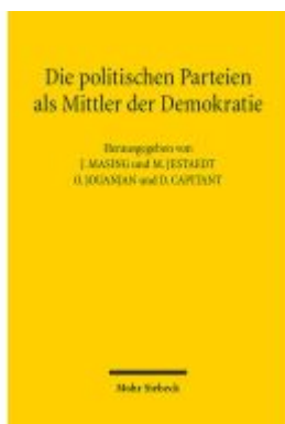
Die politischen Parteien als Mittler der Demokratie Ladenpreis: 81,30EUR