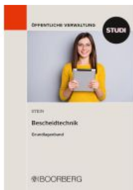
Bescheidtechnik Ladenpreis: 23,50EUR