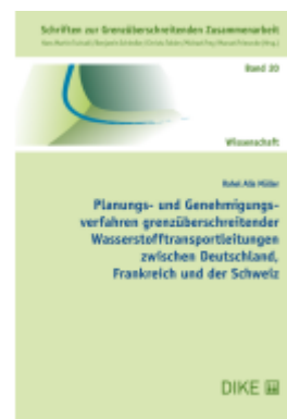
Planungs- und Genehmigungsverfahren grenzüberschreitender Wasserstofftransportleitungen zwischen Deutschland, Frankreich und der Schweiz Ladenpreis: 58,00EUR