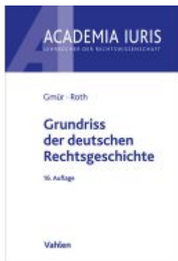
Grundriss der deutschen Rechtsgeschichte Ladenpreis: 27,70EUR