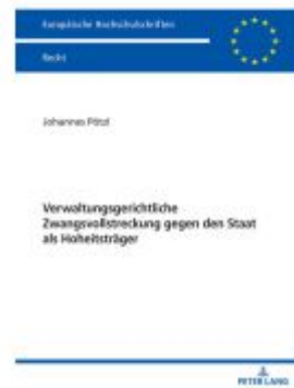
Verwaltungsgerichtliche Zwangsvollstreckung gegen den Staat als Hoheitsträger Ladenpreis: 63,70EUR