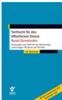
Tarifrecht für den öffentlichen Dienst - Bund/Gemeinden Ladenpreis: 20,50EUR