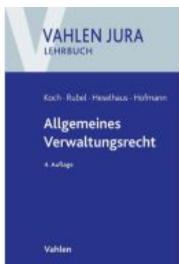
Allgemeines Verwaltungsrecht Ladenpreis: 35,90EUR