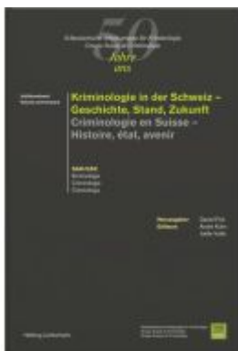
Kriminologie in der Schweiz - Geschichte, Stand, Zukunft - Criminologie en Suisse - Histoire, état, avenir Ladenpreis: 86,00EUR