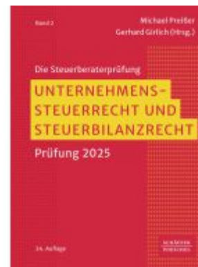
Unternehmenssteuerrecht und Steuerbilanzrecht Ladenpreis: 154,20EUR