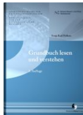
Grundbuch lesen und verstehen Ladenpreis: 20,50EUR