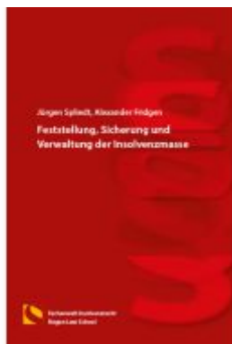
Feststellung, Sicherung und Verwaltung der Insolvenzmasse Ladenpreis: 16,40EUR