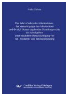
Das Fehlverhalten des Arbeitnehmers, der Verdacht gegen den Arbeitnehmer und die sich hieraus ergebenden Gestaltungsrechte des Arbeitgebers unter besonderer Berücksichtigung von Tat-, Verdachts- und Tatindizkündigung Ladenpreis: 117,10EUR