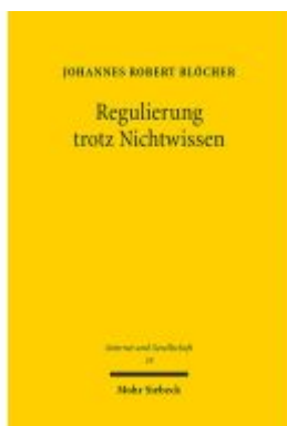
Regulierung trotz Nichtwissen Ladenpreis: 112,10EUR