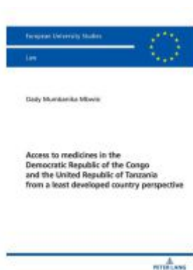
Access to medicines in the Democratic Republic of the Congo and the United Republic of Tanzania from a least developed country perspective Ladenpreis: 56,50EUR