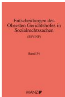
Entscheidungen des obersten Gerichtshofes in Sozialrechtssachen SSV- NF Ladenpreis: 322,00EUR