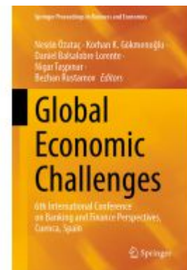
Global Economic Challenges Ladenpreis: 186,99EUR