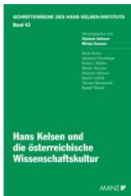
Hans Kelsen und die österreichische Wissenschaftskultur Ladenpreis: 38,00EUR