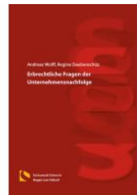
Erbrechtliche Fragen der Unternehmensnachfolge Ladenpreis: 40,10EUR

Alle Preise inkl. MwSt. zzgl. Versand. Bei Bestellung im LexisNexis Onlineshop kostenloser Versand innerhalb Österreichs.