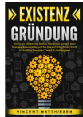
EXISTENZGRÜNDUNG: Wie Sie ein erfolgreiches Startup Unternehmen gründen, einen Businessplan ausarbeiten und Ihre Idee zum Erfolg führen. Schritt für Schritt zur finanziellen Freiheit & Unabhängigkeit Ladenpreis: 16,40EUR