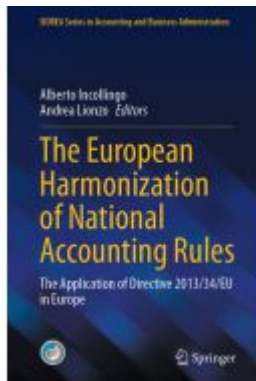
The European Harmonization of National Accounting Rules Ladenpreis: 164,99EUR

Wir haben andere Produkte gefunden, die Ihnen gefallen könnten!