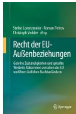
Recht der EU-Außenbeziehungen Ladenpreis: 133,63EUR