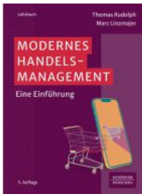
Modernes Handelsmanagement Ladenpreis: 41,20EUR