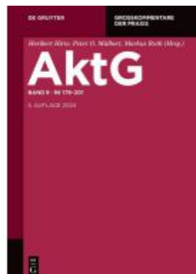
§§ 179-201 Ladenpreis: 279,00EUR