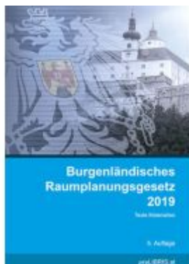
Burgenländisches Raumplanungsgesetz 2019 Ladenpreis: 28,00EUR