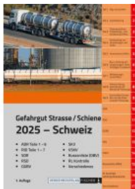
ADR/RID 2025 Schweiz Ladenpreis: 85,80EUR