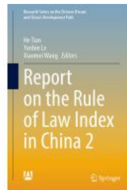
Report on the Rule of Law Index in China 2 Ladenpreis: 175,99EUR