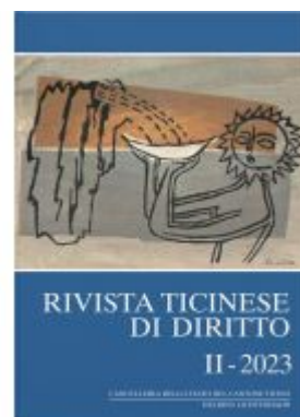
Rivista ticinese di diritto II-2023 Ladenpreis: 130,00EUR