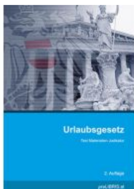
Urlaubsgesetz Ladenpreis: 13,00EUR