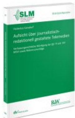
Aufsicht über journalistisch-redaktionell gestaltete Telemedien Ladenpreis: 50,40EUR

Wir haben andere Produkte gefunden, die Ihnen gefallen könnten!