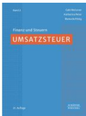
Umsatzsteuer Ladenpreis: 72,00EUR