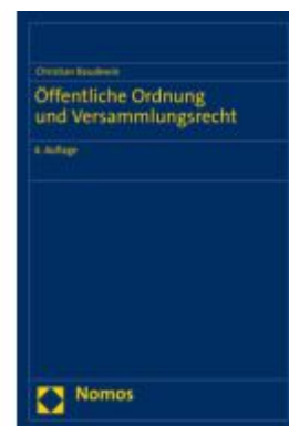
Öffentliche Ordnung und Versammlungsrecht Ladenpreis: 101,80EUR