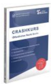
CRASHKURS Öffentliches Recht - Berlin Ladenpreis: 26,70EUR