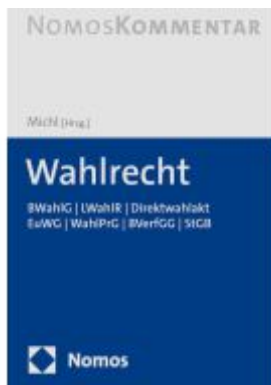
Wahlrecht Ladenpreis: 172,80EUR