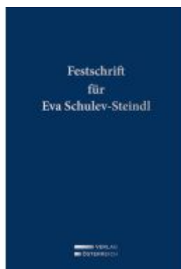
Festschrift für Eva Schulev-Steindl Ladenpreis: 199,00EUR