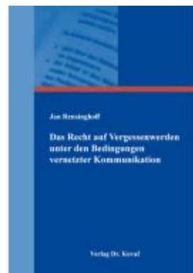
Das Recht auf Vergessenwerden unter den Bedingungen vernetzter Kommunikation Ladenpreis: 91,40EUR