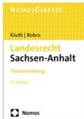
Landesrecht Sachsen-Anhalt Ladenpreis: 30,80EUR