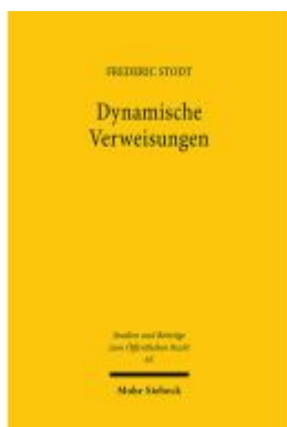
Dynamische Verweisungen Ladenpreis: 96,70EUR