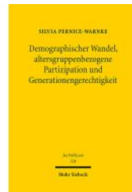
Demographischer Wandel, altersgruppenbezogene Partizipation und Generationengerechtigkeit Ladenpreis: 127,50EUR