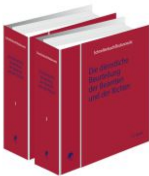
Die dienstliche Beurteilung der Beamten und der Richter Ladenpreis: 180,00EUR