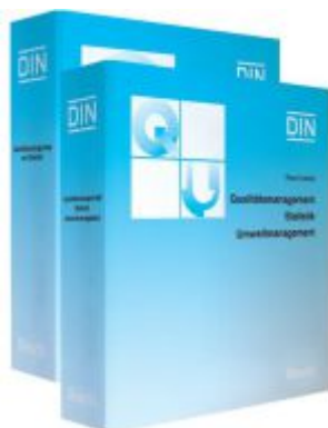
Qualitätsmanagement, Statistik, Umweltmanagement. Teil A, Teil B/C, Teil D und Teil E / Qualitätsmanagement - Statistik - Umweltmanagement. Teil A und Teil B/C Ladenpreis: 347,50EUR