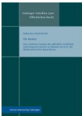
Die Baulast Ladenpreis: 41,20EUR