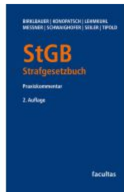
StGB Strafgesetzbuch Ladenpreis: 268,00EUR