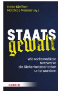
Staatsgewalt Ladenpreis: 24,70EUR