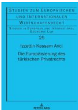
Die Europäisierung des türkischen Privatrechts Ladenpreis: 107,90EUR