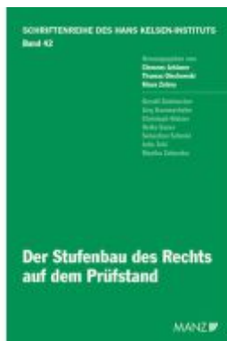
Der Stufenbau des Rechts auf dem Prüfstand Ladenpreis: 38,00EUR