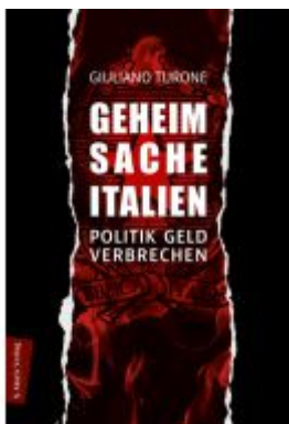
Geheimsache Italien Ladenpreis: 30,80EUR