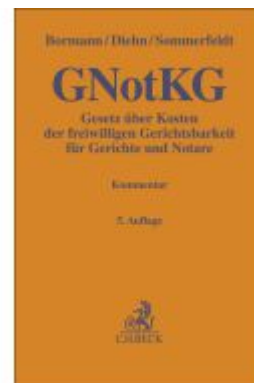
Gesetz über Kosten der freiwilligen Gerichtsbarkeit für Gerichte und Notare Ladenpreis: 159,40EUR