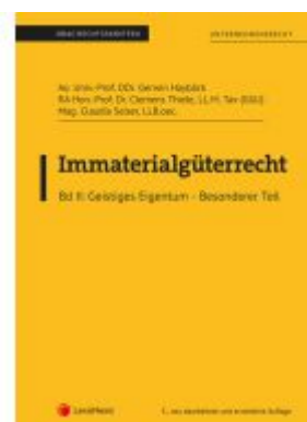
Immateriälgüterrecht (Skriptum) - Bd II Ladenpreis: 36,00EUR