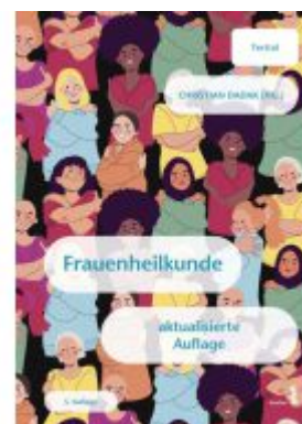
Frauenheilkunde Ladenpreis: 24,90EUR