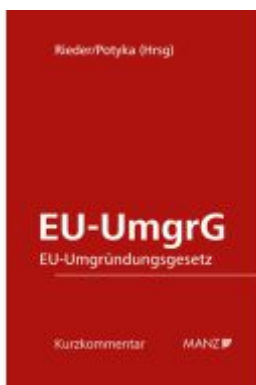
EU-Umgründungsgesetz Ladenpreis: 118,00EUR