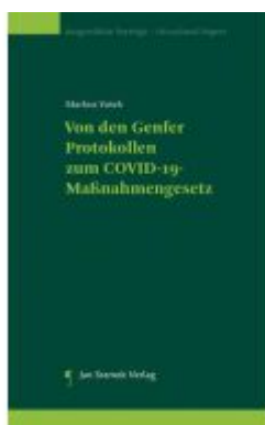
Von den Genfer Protokollen zum COVID-19-Maßnahmegesetz Ladenpreis: 39,90EUR