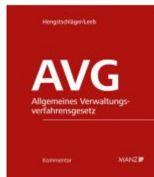
AVG-Kommentar 2.Ausgabe Ladenpreis: 248,00EUR