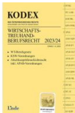
KODEX Wirtschaftstreuhand-Berufsrecht 2023/24 Ladenpreis: 24,00EUR