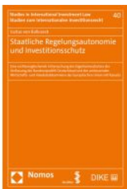
Staatliche Regelungsautonomie und Investitionsschutz Ladenpreis: 63,80EUR