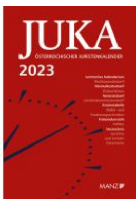
Österreichischer Juristenkalender 2023 JuKa Ladenpreis: 142,00EUR