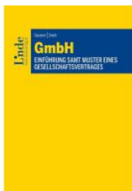
GmbH Ladenpreis: 49,00EUR