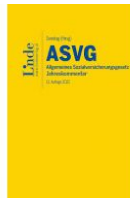
ASVG | Allgemeines Sozialversicherungsrecht 2022 Ladenpreis: 178,00EUR