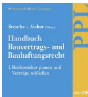
PAKET: Handbuch Bauvertrags- und Bauhaftungsrecht Band I: Rechtssicher Planen Ladenpreis: 199,00EUR