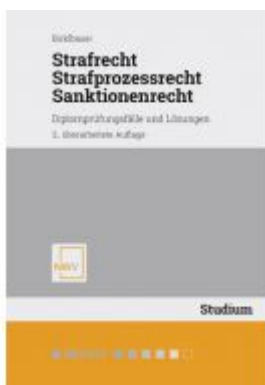
Strafrecht, Strafprozessrecht, Sanktionenrecht Ladenpreis: 32,00EUR