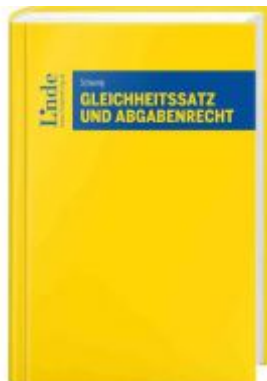
Gleichheitssatz und Abgabenrecht Ladenpreis: 79,00EUR