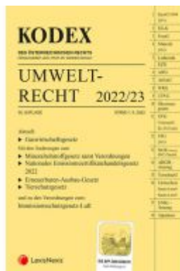
KODEX Umweltrecht 2022/23 - inkl. App Ladenpreis: 109,00EUR