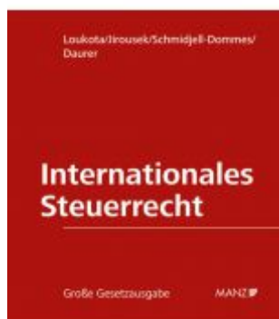
Internationales Steuerrecht Ladenpreis: 498,00EUR