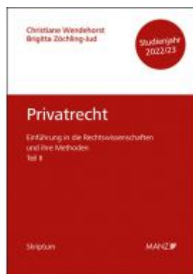
Privatrecht Einführung in die Rechtswissenschaften und ihre Methoden: Teil II Ladenpreis: 14,70EUR