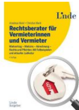
Rechtsberater für Vermieterinnen und Vermieter Ladenpreis: 29,90EUR