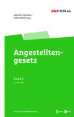
Angestelltengesetz Ladenpreis: 129,00EUR