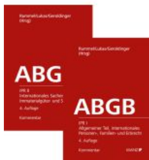
PAKET: ABGB-Kommentar 4.Auflage Internationales Privatrecht Band I + II Ladenpreis: 428,00EUR