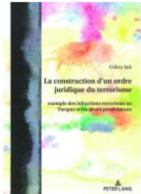
La construction d'un ordre juridique du terrorisme Ladenpreis: 123,40EUR