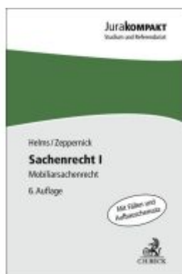
Sachenrecht I Ladenpreis: 15,40EUR