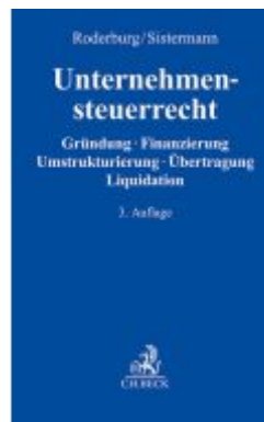
Unternehmensteuerrecht Ladenpreis: 153,20EUR