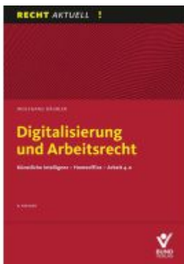
Digitalisierung und Arbeitsrecht Ladenpreis: 47,30EUR