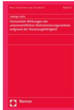
Horizontale Wirkungen der unionsrechtlichen Diskriminierungsverbote aufgrund der Staatsangehörigkeit Ladenpreis: 132,70EUR