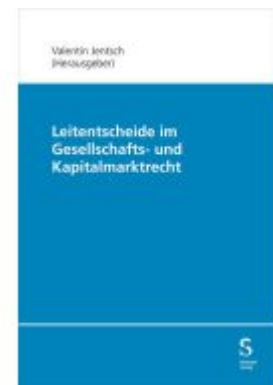
Leitentscheide im Gesellschafts- und Kapitalmarktrecht Ladenpreis: 186,90EUR