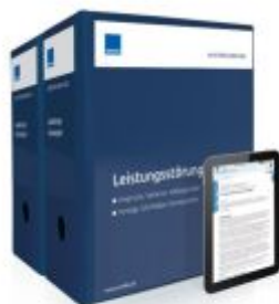
Mustersammlung Leistungsstörungen Ladenpreis: 261,80EUR