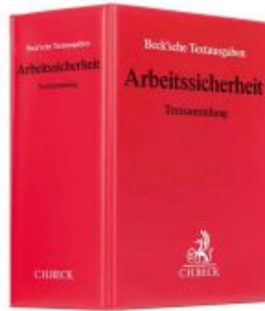
Arbeitsicherheit Ladenpreis: 71,00EUR