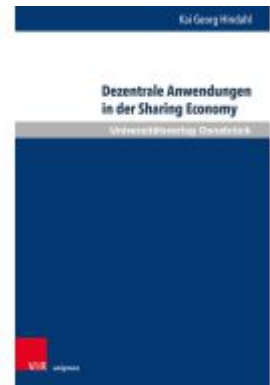
Dezentrale Anwendungen in der Sharing Economy Ladenpreis: 42,00EUR