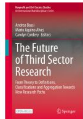
The Future of Third Sector Research Ladenpreis: 54,99EUR