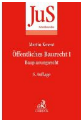
Öffentliches Baurecht I: Bauplanungsrecht Ladenpreis: 41,00EUR