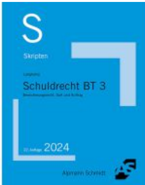
Skript Schuldrecht BT 3 Ladenpreis: 20,50EUR

Wir haben andere Produkte gefunden, die Ihnen gefallen könnten!