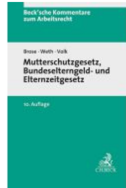
Mutterschutzgesetz und Bundeselterngeld- und Elternzeitgesetz Ladenpreis: 101,80EUR