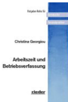
Arbeitszeit und Betriebsverfassung Ladenpreis: 20,10EUR