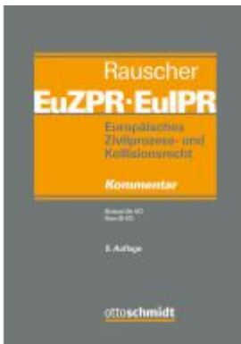
Europäisches Zivilprozess- und Kollisionsrecht EuZPR/EuIPR, Band IV/I Ladenpreis: 225,20EUR