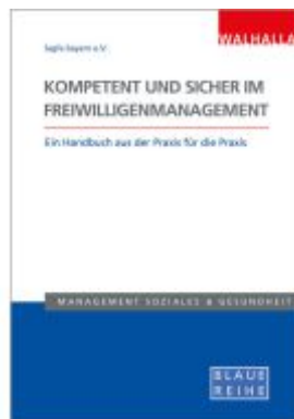
Kompetent und sicher im Freiwilligenmanagement Ladenpreis: 39,10EUR