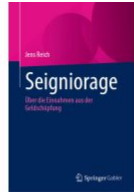
Seigniorage Ladenpreis: 82,23EUR