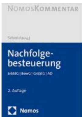
Nachfolgebesteuerung Ladenpreis: 132,70EUR