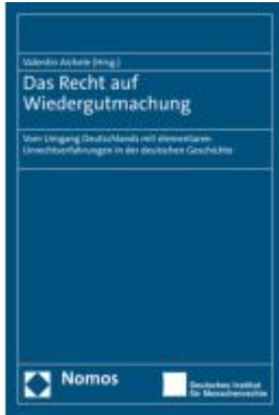
Das Recht auf Wiedergutmachung Ladenpreis: 101,80EUR