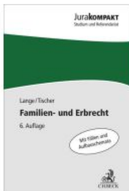
Familien- und Erbrecht Ladenpreis: 13,30EUR

Wir haben andere Produkte gefunden, die Ihnen gefallen könnten!