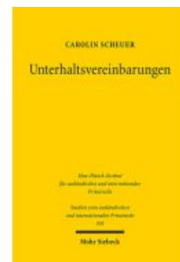
Unterhaltsvereinbarungen Ladenpreis: 76,10EUR