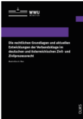
Die rechtlichen Grundlagen und aktuellen Entwicklungen der Verbandsklage im deutschen und österreichischen Zivil- und Zivilprozessrecht Ladenpreis: 32,90EUR