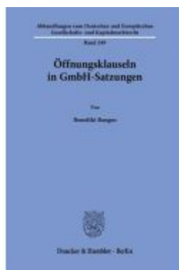
Öffnungsklauseln in GmbH-Satzungen Ladenpreis: 82,20EUR