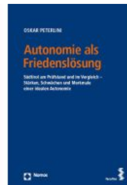
Autonomie als Friedenslösung Ladenpreis: 82,30EUR