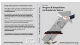
Mergers & Acquisitions im Wandel der Zeiten Ladenpreis: 16,50EUR