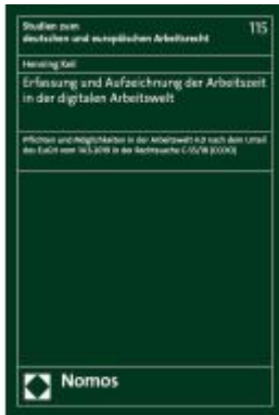
Erfassung und Aufzeichnung der Arbeitszeit in der digitalen Arbeitswelt Ladenpreis: 158,40EUR