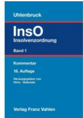
Insolvenzordnung Band 1 Ladenpreis: 256,00EUR