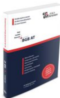
BGB AT Ladenpreis: 29,80EUR