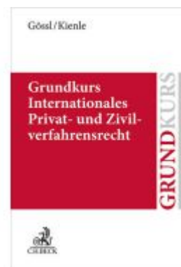
Grundkurs Internationales Privat- und Zivilverfahrensrecht Ladenpreis: 30,70EUR