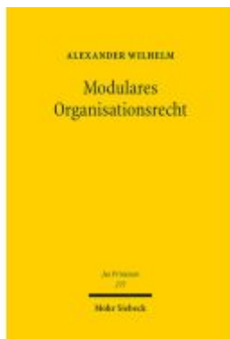
Modulares Organisationsrecht Ladenpreis: 142,90EUR