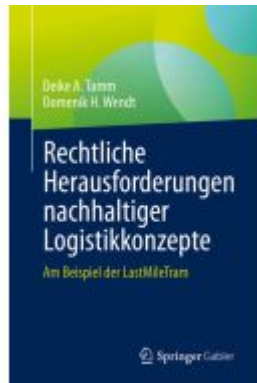
Rechtliche Herausforderungen nachhaltiger Logistikkonzepte Ladenpreis: 39,05EUR