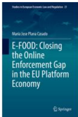
E-FOOD: Closing the Online Enforcement Gap in the EU Platform Economy Ladenpreis: 142,99EUR