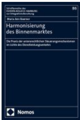
Harmonisierung des Binnenmarktes Ladenpreis: 194,30EUR