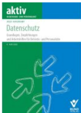
Datenschutz Ladenpreis: 40,10EUR