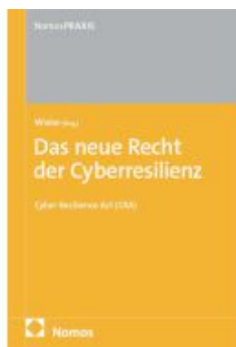
Das neue Recht der Cyberresilienz Ladenpreis: 40,10EUR