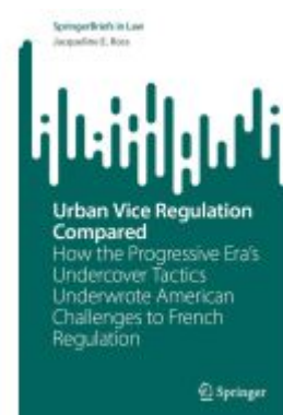
Urban Vice Regulation Compared Ladenpreis: 43,99EUR