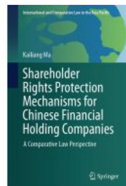
Shareholder Rights Protection Mechanisms for Chinese Financial Holding Companies Ladenpreis: 175,99EUR