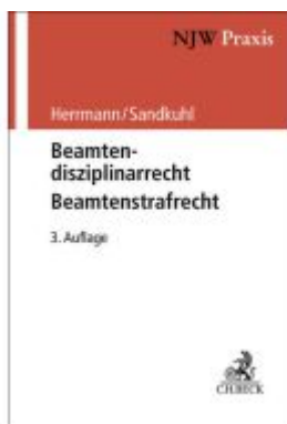
Beamtendisziplinarrecht - Beamtenstrafrecht Ladenpreis: 101,80EUR