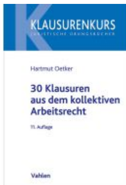
30 Klausuren aus dem kollektiven Arbeitsrecht Ladenpreis: 25,60EUR

Wir haben andere Produkte gefunden, die Ihnen gefallen könnten!