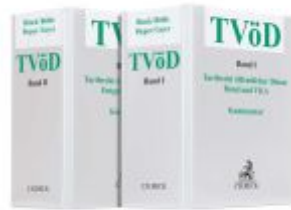
TVöD Ladenpreis: 91,50EUR