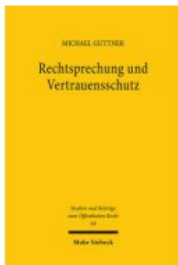
Rechtsprechung und Vertrauensschutz Ladenpreis: 127,50EUR