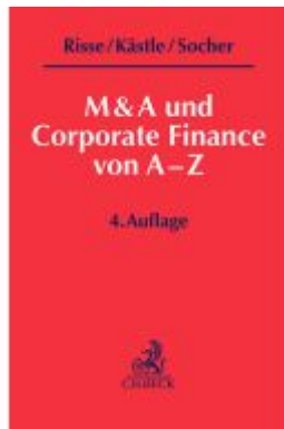
M&A und Corporate Finance von A-Z Ladenpreis: 50,40EUR