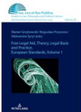
Free Legal Aid, Theory, Legal Basis and Practice. European Standards Ladenpreis: 61,60EUR

Wir haben andere Produkte gefunden, die Ihnen gefallen könnten!