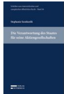
Die Verantwortung des Staates für seine Aktiengesellschaften Ladenpreis: 49,00EUR