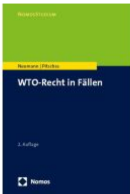
WTO-Recht in Fällen Ladenpreis: 41,10EUR