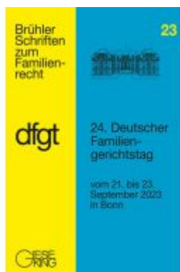
24. Deutscher Familiengerichtstag Ladenpreis: 40,10EUR