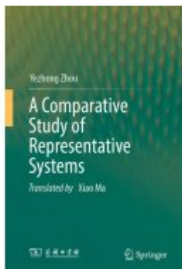
A Comparative Study of Representative Systems Ladenpreis: 175,99EUR

Wir haben andere Produkte gefunden, die Ihnen gefallen könnten!