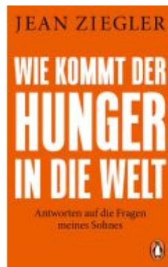
Wie kommt der Hunger in die Welt? Ladenpreis: 13,40EUR