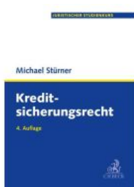
Kreditsicherungsrecht Ladenpreis: 41,00EUR