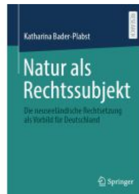
Natur als Rechtssubjekt Ladenpreis: 92,51EUR