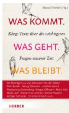
Was kommt. Was geht. Was bleibt. Ladenpreis: 36,00EUR