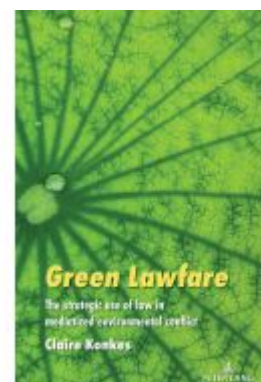
Green Lawfare Ladenpreis: 114,60EUR