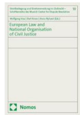
European Law and National Organisation of Civil Justice Ladenpreis: 60,70EUR