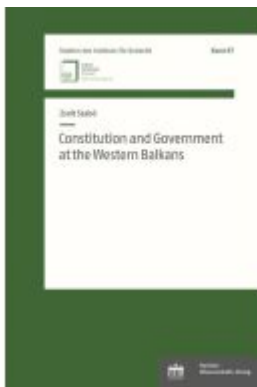
Constitution and Government at the Western Balkans Ladenpreis: 43,20EUR