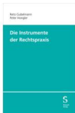
Die Instrumente der Rechtspraxis Ladenpreis: 70,60EUR