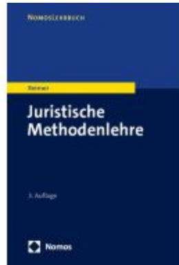
Juristische Methodenlehre Ladenpreis: 26,70EUR