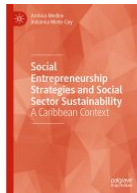
Social Entrepreneurship Strategies and Social Sector Sustainability Ladenpreis: 164,99EUR