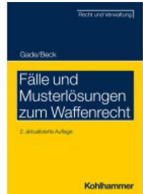
Fälle und Musterlösungen zum Waffenrecht Ladenpreis: 16,40EUR