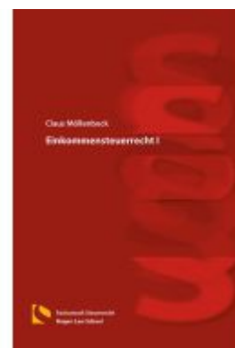
Einkommensteuerrecht I Ladenpreis: 25,70EUR