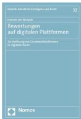
Bewertungen auf digitalen Plattformen Ladenpreis: 117,20EUR