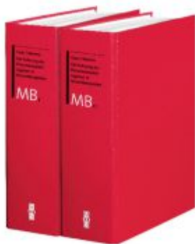
Die Führung der Personenstandsregister in Musterbeispielen Ladenpreis: 108,00EUR