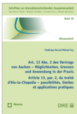
Art. 13 Abs. 2 des Vertrags von Aachen – Möglichkeiten, Grenzen und Anwendung in der Praxis Ladenpreis: 59,00EUR