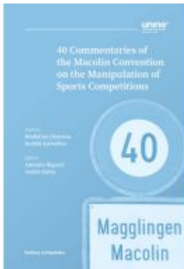
40 Commentaries of the Macolin Convention on the Manipulation of Sports Competitions Ladenpreis: 50,00EUR