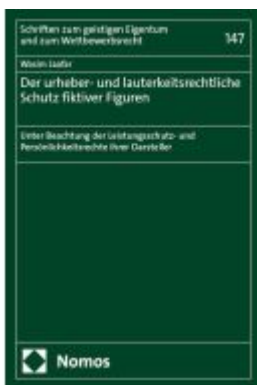
Der urheber- und lauterkeitsrechtliche Schutz fiktiver Figuren Ladenpreis: 71,00EUR