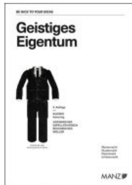
Geistiges Eigentum Ladenpreis: 54,00EUR