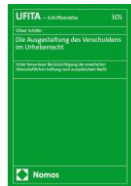
Die Ausgestaltung des Verschuldens im Urheberrecht Ladenpreis: 101,80EUR