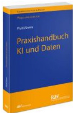
Praxishandbuch KI und Daten Ladenpreis: 91,50EUR

Wir haben andere Produkte gefunden, die Ihnen gefallen könnten!