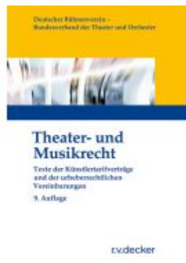
Theater- und Musikrecht Ladenpreis: 30,80EUR