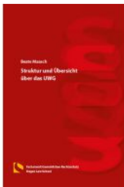
Struktur und Übersicht über das UWG Ladenpreis: 17,50EUR