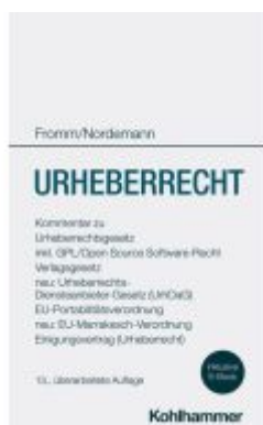
Urheberrecht Ladenpreis: 358,78EUR