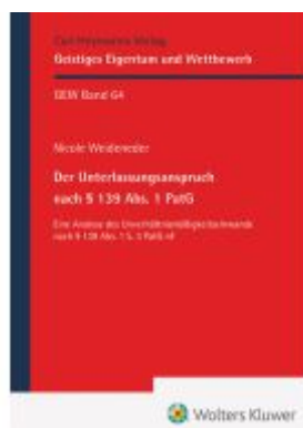
Der Unterlassungsanspruch nach § 139 Abs. 1 PatG Ladenpreis: 81,30EUR