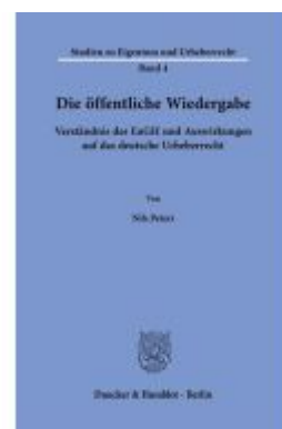
Die öffentliche Wiedergabe. Ladenpreis: 113,00EUR