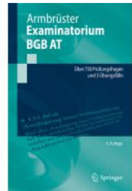
Examinatorium BGB AT Ladenpreis: 30,83EUR