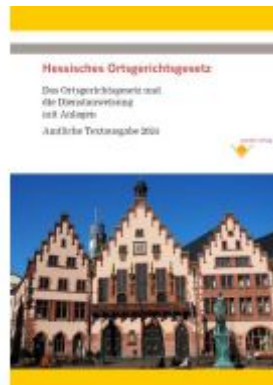
Hessisches Ortsgerichtsgesetz - Das Gesetz und die Dienstanweisung mit Anlagen Ladenpreis: 17,50EUR