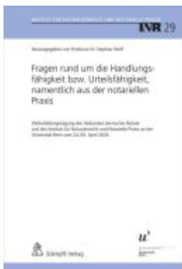
Fragen rund um die Handlungsfähigkeit bzw. Urteilsfähigkeit, namentlich aus der notariellen Praxis Ladenpreis: 63,60EUR