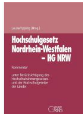
Gesetz über die Hochschulen des Landes Nordrhein-Westfalen (Hochschulgesetz - HG) Ladenpreis: 183,00EUR