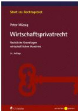
Müssig, Wirtschaftsprivatright Ladenpreis: 37,10EUR