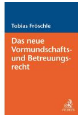
Das neue Vormundschafts- und Betreuungsrecht Ladenpreis: 50,40EUR