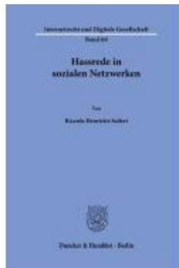
Hassrede in sozialen Netzwerken Ladenpreis: 102,70EUR