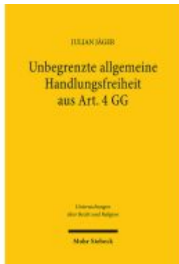
Unbegrenzte allgemeine Handlungsfreiheit aus Art. 4 GG Ladenpreis: 91,50EUR