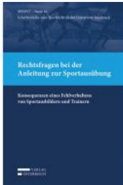
Rechtsfragen bei der Anleitung zur Sportausübung Ladenpreis: 39,00 EUR