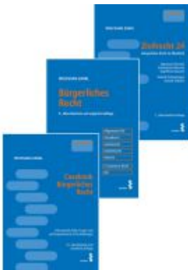
Kombipaket Casebook Bürgerliches Recht, Bürgerliches Recht und Zivilrecht 24 Ladenpreis: 85,00 EUR