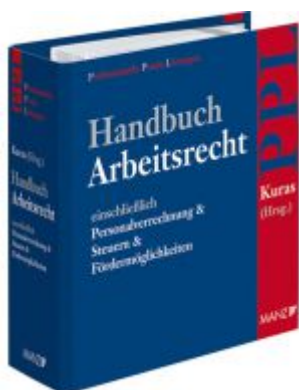
Handbuch Arbeitsrecht Ladenpreis: 198,00 EUR