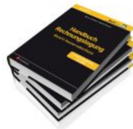
PAKET Handbuch Rechnungslegung, Bände 1 bis 3 Ladenpreis: 351,00 EUR