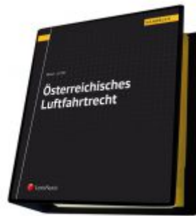
Österreichisches Luftfahrtrecht Ladenpreis: 460,00 EUR