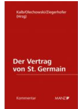
Der Vertrag von St. Germain Ladenpreis: 198,00 EUR