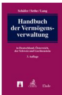
Handbuch der Vermögensverwaltung Ladenpreis: 229,00 EUR