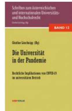
Die Universität in der Pandemie Ladenpreis: 34,00 EUR