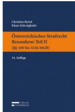
Österreichisches Strafrecht. Besonderer Teil II (§§ 169 bis 321k StGB) Ladenpreis: 36,00 EUR