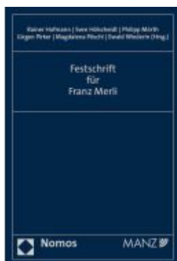
Festschrift für Franz Merli Ladenpreis: 225,20EUR