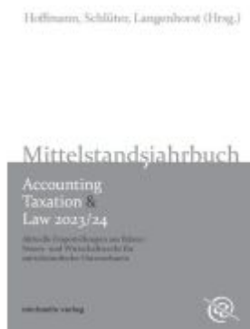
Mittelstandsjahrbuch - Accounting, Taxation & Law 2023/24 Ladenpreis: 41,10EUR

Wir haben andere Produkte gefunden, die Ihnen gefallen könnten!