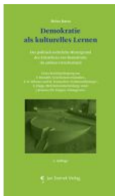
Demokratie als kulturelles Lernen Ladenpreis: 29,90EUR