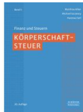
Körperschaftsteuer Ladenpreis: 72,00EUR