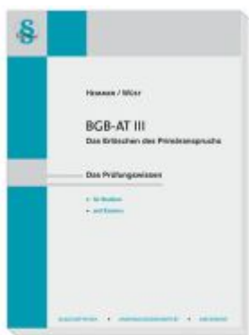
BGB AT III - Das Erlöschen des Primäranspruchs Ladenpreis: 23,60EUR