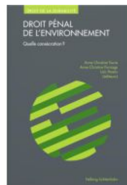
Droit pénal de l'environnement Ladenpreis: 108,00EUR