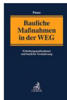
Bauliche Maßnahmen der Gemeinschaft der Wohnungseigentümer Ladenpreis: 204,60EUR