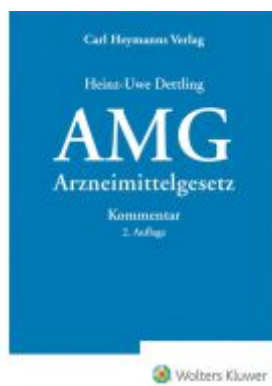
Arzneimittelgesetz - AMG