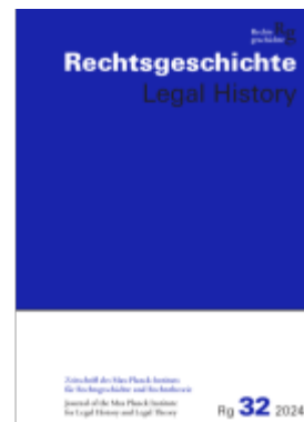
Rechtsgeschichte Legal History (RG). Zeitschrift des Max Planck-Instituts für Rechtsgeschichte und Rechtstheorie/Rechtsgeschichte Legal History Ladenpreis: 50,40EUR