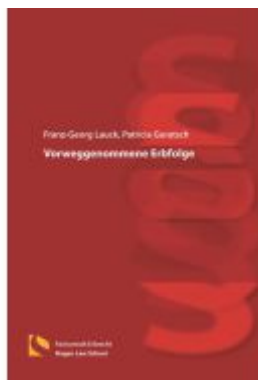
Vorweggenommene Erbfolge Ladenpreis: 25,70EUR