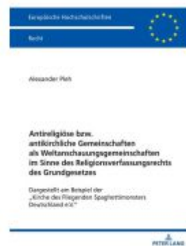
Antireligiöse bzw. antikirchliche Gemeinschaften als Weltanschauungsgemeinschaften im Sinne des Religionsverfassungsrechts des Grundgesetzes