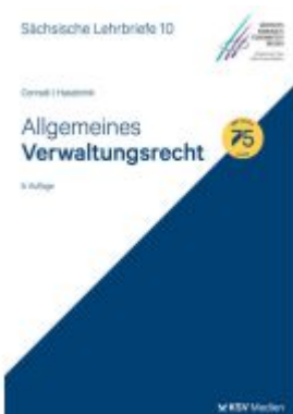
Allgemeines Verwaltungsrecht (SL 10)