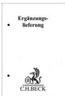
Rechtshandbuch Vermögen und Investitionen in der ehemaligen DDR 74. Ergänzungslieferung Ladenpreis: 51,20EUR