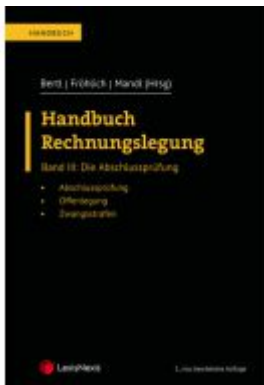
Handbuch Rechnungslegung / Handbuch Rechnungslegung, Band III: Die Abschlussprüfung Ladenpreis: 110,00 EUR