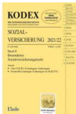
KODEX Sozialversicherung 2021/22, Band II Ladenpreis: 40,00 EUR