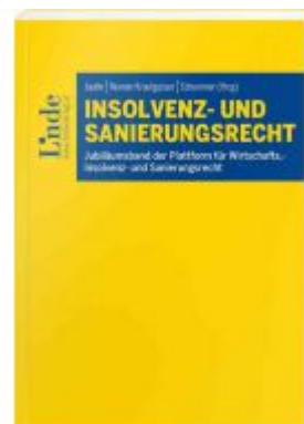
Insolvenz- und Sanierungsrecht Ladenpreis: 69,00 EUR