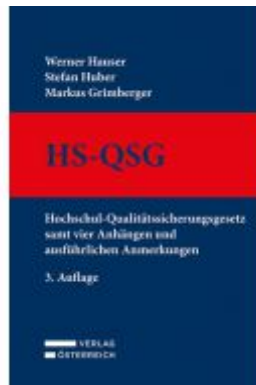
HS-QSG Hochschul- Qualitätssicherungsgesetz Ladenpreis: 119,00 EUR