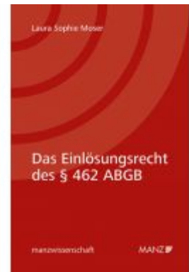
Das Einlösungsrecht des § 462 ABGB Ladenpreis: 59,00 EUR