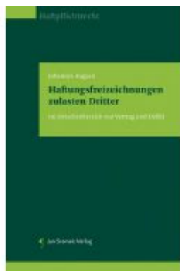
Haftungsfreizeichnungen zulasten Dritter Ladenpreis: 78,00 EUR

Wir haben andere Produkte gefunden, die Ihnen gefallen könnten!