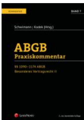
ABGB Praxiskommentar / ABGB Praxiskommentar - Band 7, 5. Auflage Ladenpreis: 249,00 EUR