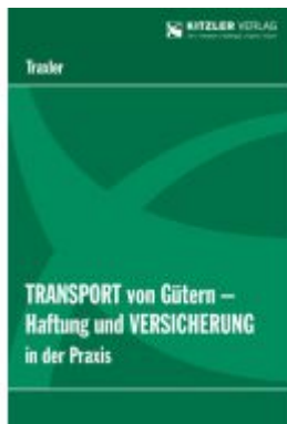
Transport von Gütern Ladenpreis: 44,00 EUR