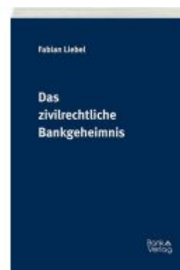
Das zivilrechtliche Bankgeheimnis Ladenpreis: 50,00 EUR