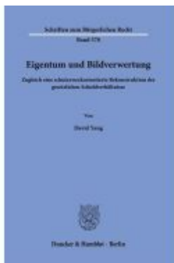
Eigentum und Bildverwertung Ladenpreis: 92,50EUR