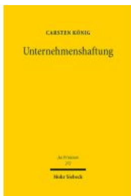
Unternehmenshaftung Ladenpreis: 153,20EUR