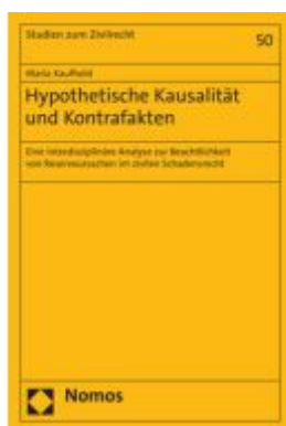
Hypothetische Kausalität und Kontrafakten Ladenpreis: 71,00EUR