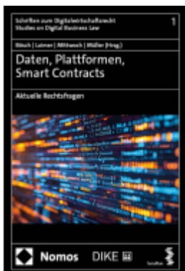
Daten, Plattformen, Smart Contracts Ladenpreis: 99,00EUR

Wir haben andere Produkte gefunden, die Ihnen gefallen könnten!