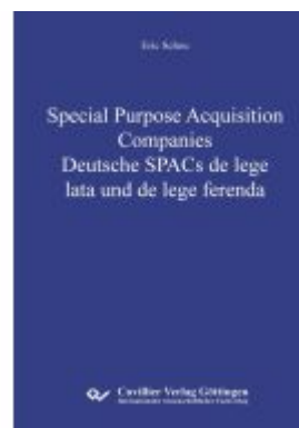
Special Purpose Acquisition Companies - Deutsche SPACs de lege lata und de lege ferenda Ladenpreis: 73,00EUR