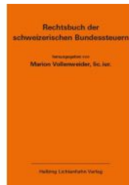
Rechtsbuch der schweizerischen Bundessteuern EL 179 Ladenpreis: 438,00EUR