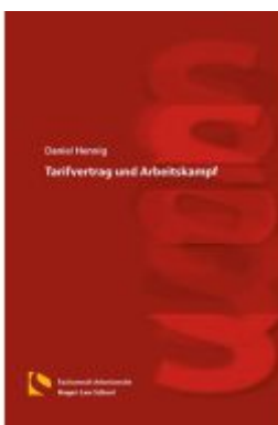
Tarifvertrag und Arbeitskampf Ladenpreis: 25,70EUR