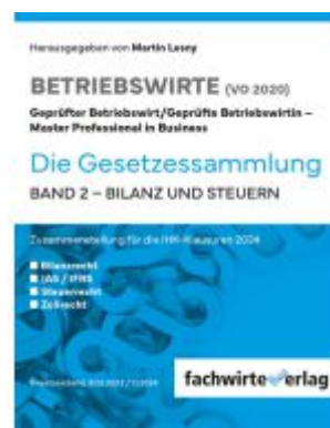
Bilanz- und Steuergesetze Ladenpreis: 25,50EUR