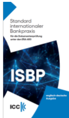
Standard internationaler Bankpraxis (ISBP) Englisch-Deutsch Ladenpreis: 29,90EUR