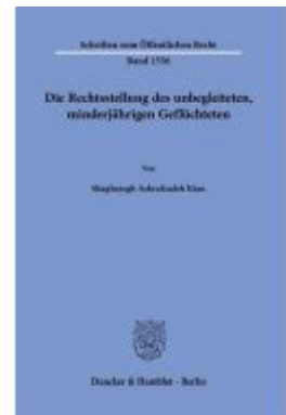
Die Rechtsstellung des unbegleiteten, minderjährigen Geflüchteten Ladenpreis: 102,70EUR