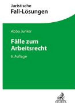
Fälle zum Arbeitsrecht Ladenpreis: 28,80EUR