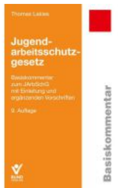
Jugendarbeitsschutzgesetz Ladenpreis: 41,10EUR