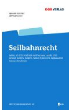
Seilbahnrecht Ladenpreis: 109,00EUR