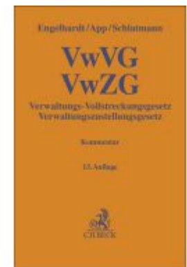
Verwaltungs-Vollstreckungsgesetz, Verwaltungszustellungsgesetz Ladenpreis: 97,70EUR