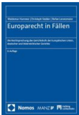
Europarecht in Fällen Ladenpreis: 41,10EUR