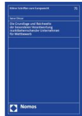
Die Grundlage und Reichweite der besonderen Verantwortung marktbeherrschender Unternehmen für Wettbewerb Ladenpreis: 71,00EUR