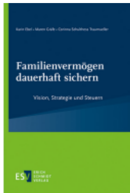
Familienvermögen dauerhaft sichern Ladenpreis: 51,20EUR

Wir haben andere Produkte gefunden, die Ihnen gefallen könnten!