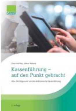
Kassenführung - auf den Punkt gebracht, 2. Auflage Ladenpreis: 20,60EUR