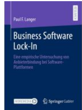
Business Software Lock-In Ladenpreis: 102,80EUR