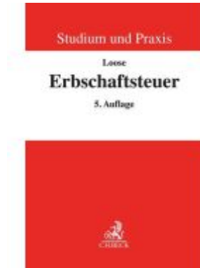
Erbschaftsteuerrecht Ladenpreis: 40,00EUR