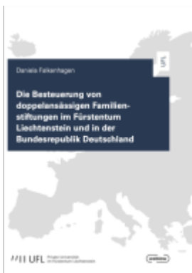
Die Besteuerung von doppelansässigen Familienstiftungen im Fürstentum Liechtenstein und in der Bundesrepublik Deutschland Ladenpreis: 49,00EUR