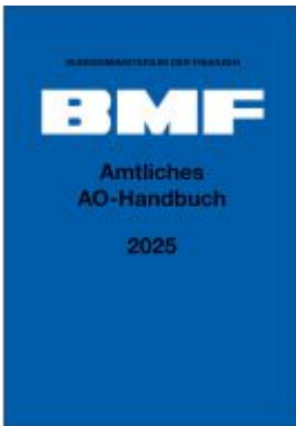
Amtliches AO-Handbuch 2025 Ladenpreis: 24,20EUR