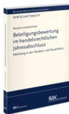
Beteiligungsbewertung im handelsrechtlichen Jahresabschluss Ladenpreis: 91,50EUR