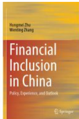
Financial Inclusion in China Ladenpreis: 131,99EUR