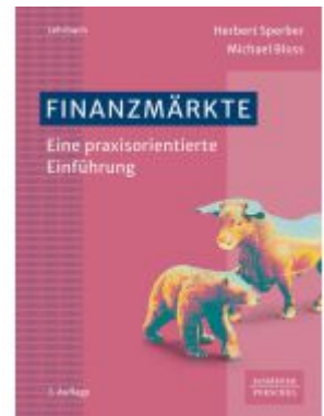
Finanzmärkte Ladenpreis: 30,90EUR