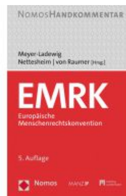
EMRK - Europäische Menschenrechtskonvention Ladenpreis: 142,90EUR