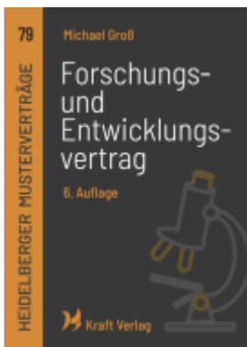
Forschungs- und Entwicklungsvertrag Ladenpreis: 16,50EUR