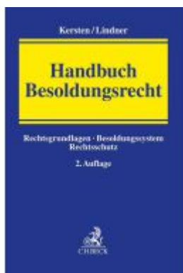
Handbuch Besoldungsrecht Ladenpreis: 132,70EUR