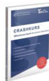
CRASHKURS Öffentliches Recht - NRW Ladenpreis: 26,70EUR