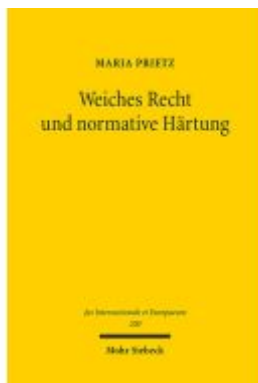
Weiches Recht und normative Härting Ladenpreis: 86,40EUR