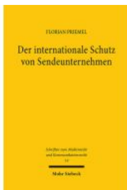
Der internationale Schutz von Sendeunternehmen Ladenpreis: 91,50EUR