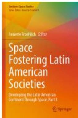
Space Fostering Latin American Societies Ladenpreis: 153,99EUR