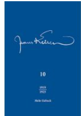
Hans Kelsen Werke Ladenpreis: 215,90EUR