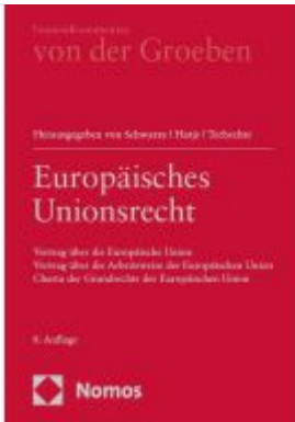
Europäisches Unionsrecht Ladenpreis: 1.017,80EUR