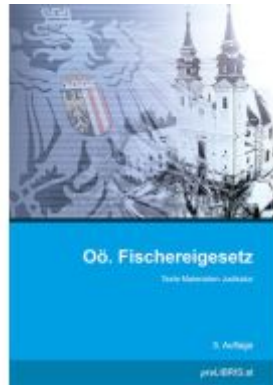
Oö. Fischereigesetz Ladenpreis: 25,00EUR