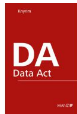
DA - Data Act Ladenpreis: 48,00EUR