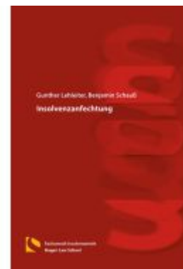
Insolvenzanfechtung Ladenpreis: 25,70EUR