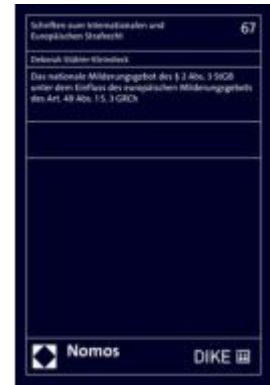
Das nationale Milderungsgebot des § 2 Abs. 3 StGB unter dem Einfluss des europäischen Milderungsgebots des Art. 49 Abs. 1 S. 3 GRCh Ladenpreis: 96,70EUR