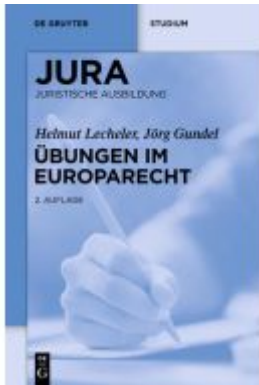
Übungen im Europarecht Ladenpreis: 19,95EUR