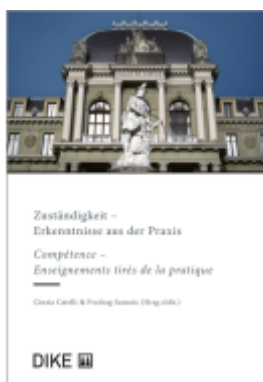
Zuständigkeit - Erkenntnisse aus der Praxis Ladenpreis: 86,00EUR