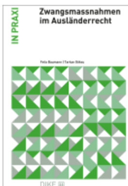
Zwangsmassnahmen im Ausländerrecht Ladenpreis: 103,00EUR