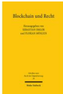
Blockchain und Recht Ladenpreis: 117,20EUR