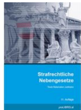
Strafrechtliche Nebengesetze Ladenpreis: 28,00EUR