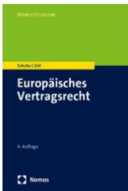
Europäisches Vertragsrecht Ladenpreis: 27,70EUR