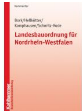
Landesbauordnung für Nordrhein- Westfalen Ladenpreis: 87,40EUR