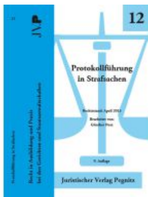
Protokollführung in Strafsachen Ladenpreis: 22,70EUR