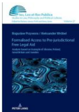
Formalised Access to Pre-judicial Free Legal Aid. Ladenpreis: 61,60EUR