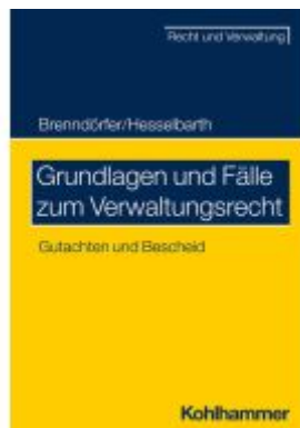
Grundlagen und Fälle zum Verwaltungsrecht Ladenpreis: 40,10EUR