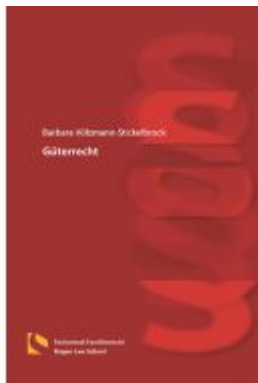
Güterrecht Ladenpreis: 25,70EUR