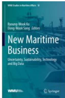
New Maritime Business Ladenpreis: 219,99EUR