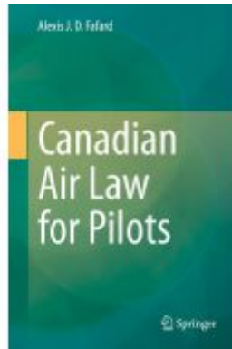
Canadian Air Law for Pilots Ladenpreis: 219,99EUR