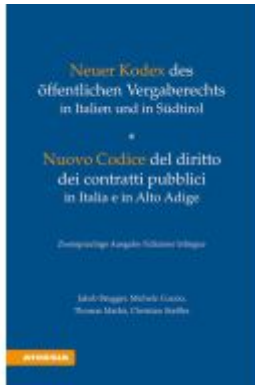
Neuer Kodex des öffentlichen Vergaberechts in Italien und in Südtirol - Nuovo Codice del diritto dei contratti pubblici in Italia e in Alto Adige Ladenpreis: 80,00EUR