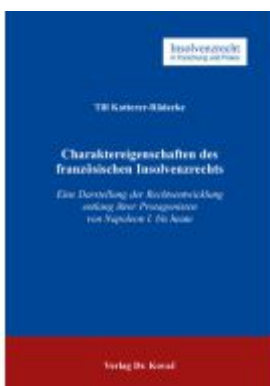
Charaktereigenschaften des französischen Insolvenzrechts Ladenpreis: 102,60EUR