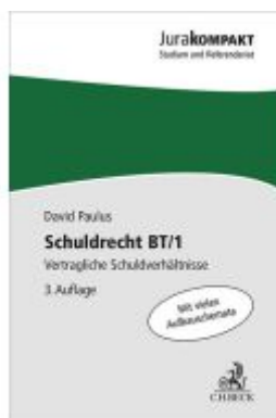
Schuldrecht BT/1 Ladenpreis: 13,30EUR