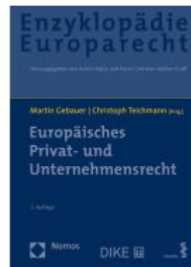
Europäisches Privat- und Unternehmensrecht Ladenpreis: 193,30EUR