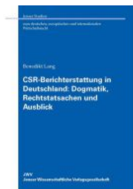
CSR-Berichterstattung in Deutschland: Dogmatik, Rechtstatsachen und Ausblick Ladenpreis: 46,10EUR