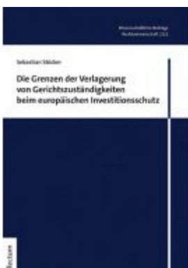
Die Grenzen der Verlagerung von Gerichtszuständigkeiten beim europäischen Investitionsschutz Ladenpreis: 65,80EUR