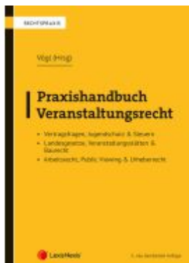
Praxishandbuch Veranstaltungsrecht Ladenpreis: 94,00EUR