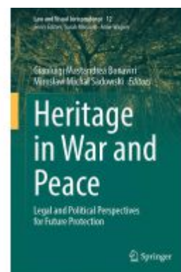
Heritage in War and Peace Ladenpreis: 197,99EUR