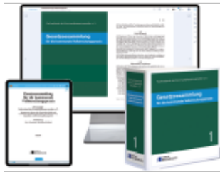
Gesetzessammlung für die kommunale Vollstreckungspraxis – Print + Digital Ladenpreis: 206,70EUR