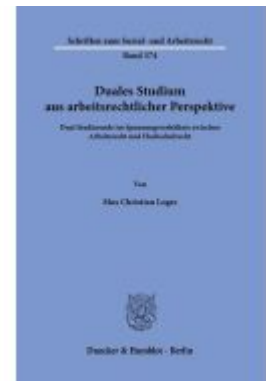
Duales Studium aus arbeitsrechtlicher Perspektive. Ladenpreis: 113,00EUR