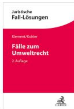
Fälle zum Umweltrecht Ladenpreis: 37,10EUR