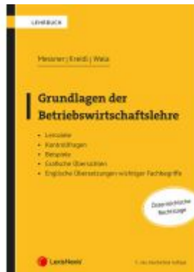
Grundlagen der Betriebswirtschaftslehre Ladenpreis: 60,00EUR