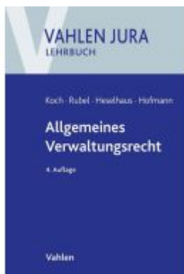
Allgemeines Verwaltungsrecht Ladenpreis: 35,90EUR