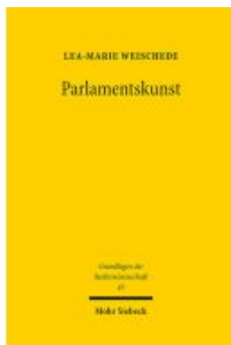
Parlamentskunst Ladenpreis: 101,80EUR