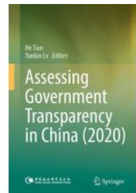
Assessing Government Transparency in China (2020) Ladenpreis: 186,99EUR