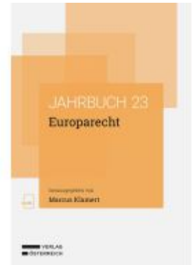
Europarecht Ladenpreis: 78,00EUR