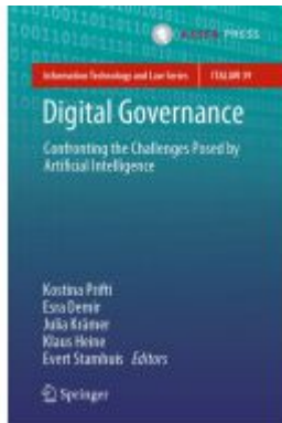
Digital Governance Ladenpreis: 197,99EUR