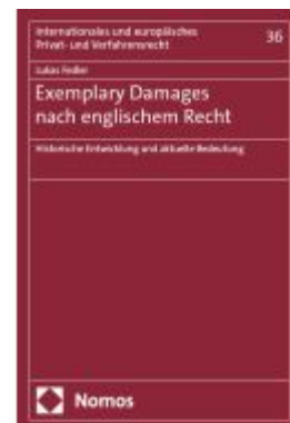
Exemplary Damages nach englischem Recht Ladenpreis: 168,60EUR