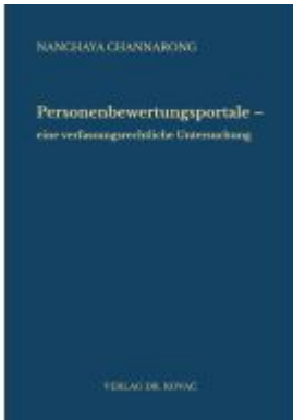
Personenbewertungsportale – eine verfassungsrechtliche Untersuchung Ladenpreis: 91,40EUR