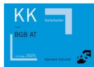
Karteikarten BGB Allgemeiner Teil Ladenpreis: 14,30EUR