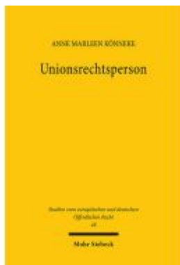
Unionsrechtsperson Ladenpreis: 96,70EUR

Wir haben andere Produkte gefunden, die Ihnen gefallen könnten!