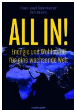
All in! Ladenpreis: 29,80EUR