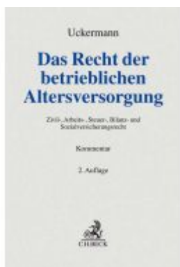
Das Recht der betrieblichen Altersversorgung Ladenpreis: 214,90EUR