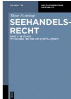
Klaus Ramming: Seehandelsrecht / §§ 570 – 619 Ladenpreis: 139,95EUR