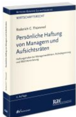
Persönliche Haftung von Managern und Aufsichtsräten Ladenpreis: 132,70EUR