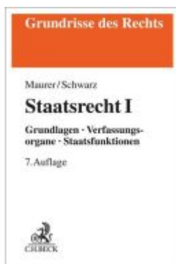
Staatsrecht I Ladenpreis: 26,70EUR