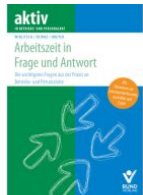
Arbeitszeit in Frage und Antwort Ladenpreis: 29,90EUR