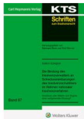
Die Bindung des Insolvenzverwalters Ladenpreis: 91,50EUR