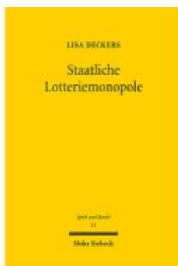
Staatliche Lotteriemonopole Ladenpreis: 91,50EUR