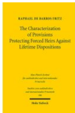
The Characterization of Provisions Protecting Forced Heirs Against Lifetime Dispositions Ladenpreis: 101,80EUR