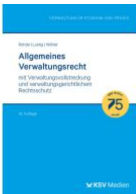
Allgemeines Verwaltungsrecht Ladenpreis: 36,00EUR