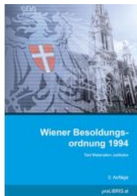
Wiener Besoldungsordnung 1994 Ladenpreis: 26,00EUR