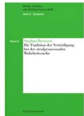
Die Funktion der Verteidigung bei der strafprozessualen Wahrheitssuche Ladenpreis: 71,00EUR