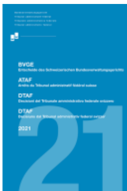
BVGE 2021 Ladenpreis: 90,00EUR