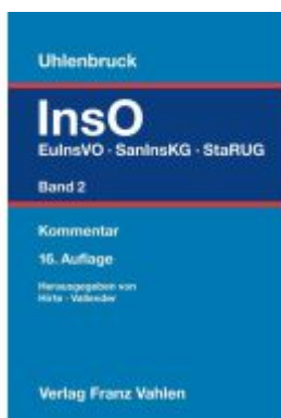
Insolvenzordnung Band 2: EulnsVO, SanInsKG (früher COVInsAG), StaRUG Ladenpreis: 122,40EUR