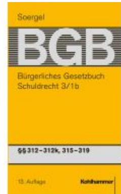
Bürgerliches Gesetzbuch mit Einführungsgesetz und Nebengesetzen (BGB) Ladenpreis: 247,00EUR