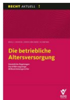
Die betriebliche Altersversorgung Ladenpreis: 29,90EUR