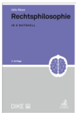
Rechtsphilosophie Ladenpreis: 64,00EUR