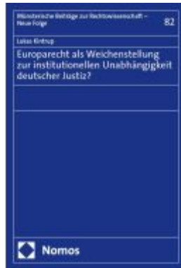
Europarecht als Weichenstellung zur institutionellen Unabhängigkeit deutscher Justiz? Ladenpreis: 122,40EUR