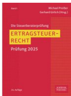
Ertragsteuerrecht Ladenpreis: 154,20EUR