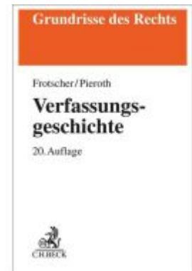
Verfassungsgeschichte Ladenpreis: 30,70EUR