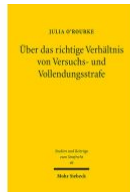
Über das richtige Verhältnis von Versuchs- und Vollendungsstrafe Ladenpreis: 76,10EUR