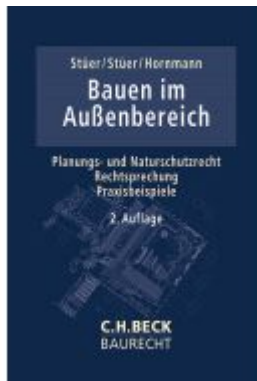
Bauen im Außenbereich Ladenpreis: 132,70EUR

Wir haben andere Produkte gefunden, die Ihnen gefallen könnten!