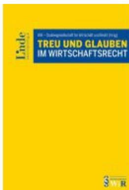
Treu und Glauben im Wirtschaftsrecht Ladenpreis: 62,00EUR