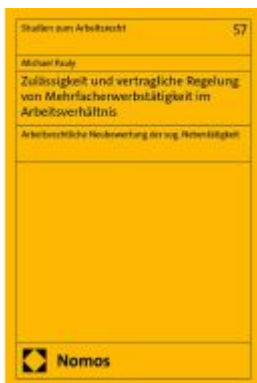
Zulässigkeit und vertragliche Regelung von Mehrfacherwerbstätigkeit im Arbeitsverhältnis Ladenpreis: 117,20EUR