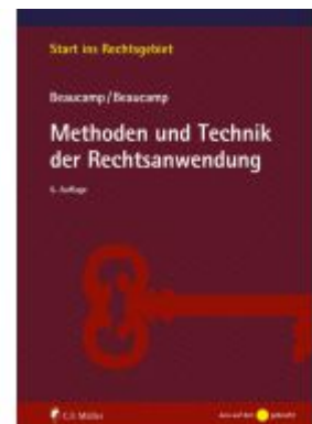
Methoden und Technik der Rechtsanwendung Ladenpreis: 24,70EUR