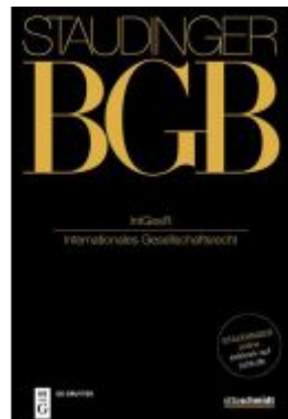
IntGesR Ladenpreis: 149,95EUR