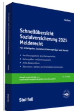
Schnellübersicht Sozialversicherung 2025 Melderecht Ladenpreis: 104,90EUR