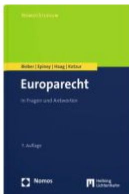
Europarecht Ladenpreis: 42,00EUR