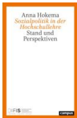
Sozialpolitik in der Hochschullehre Ladenpreis: 37,10EUR