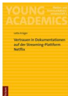
Vertrauen in Dokumentationen auf der Streaming-Plattform Netflix Ladenpreis: 29,90EUR