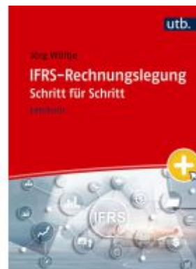
IFRS-Rechnungslegung Schritt für Schritt Ladenpreis: 30,80EUR