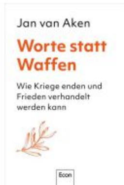
Worte statt Waffen Ladenpreis: 23,70EUR

Wir haben andere Produkte gefunden, die Ihnen gefallen könnten!