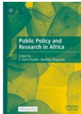
Public Policy and Research in Africa Ladenpreis: 43,99EUR