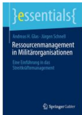
Ressourcenmanagement in Militärorganisationen Ladenpreis: 15,41EUR