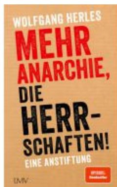
Mehr Anarchie, die Herrschaften! Ladenpreis: 22,70EUR