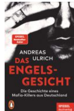
Das Engels-gesicht Ladenpreis: 14,40EUR