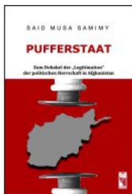
Pufferstaat Ladenpreis: 20,50EUR