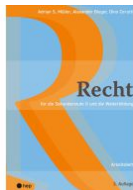
Recht Arbeitsheft Ladenpreis: 29,90EUR