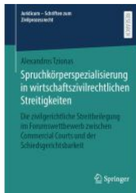
Spruchkörperspezialisierung in wirtschaftszivilrechtlichen Streitigkeiten Ladenpreis: 87,37EUR