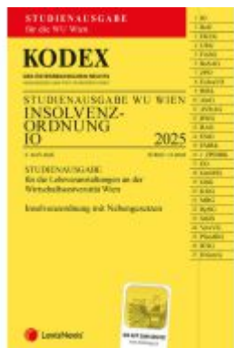
KODEX Insolvenzordnung für die WU 2025 - inkl. App Ladenpreis: 15,00EUR