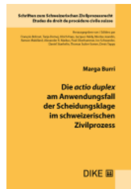
Die actio duplex am Anwendungsfall der Scheidungsklage im Schweizerischen Zivilprozess Ladenpreis: 126,00EUR