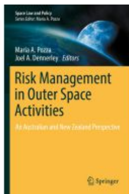
Risk Management in Outer Space Activities Ladenpreis: 164,99EUR