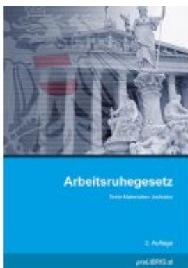
Arbeitsruhegesetz Ladenpreis: 26,00EUR