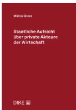
Staatliche Aufsicht über private Akteure der Wirtschaft Ladenpreis: 188,00EUR