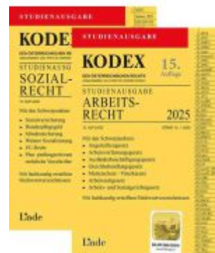
KODEX-Paket Studienausgabe Arbeits- und Sozialrecht 2025 Ladenpreis: 27,00EUR