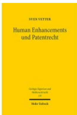
Human Enhancements und Patentrecht Ladenpreis: 132,70EUR